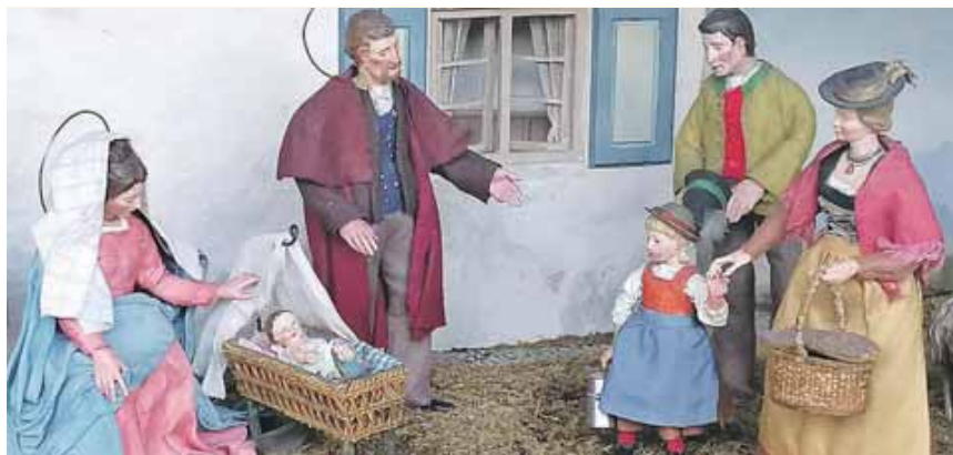
Krippen stellen die Geburt Jesu in heimatlichem Umfeld nach.

Krippenspiel, Musik: Weihnachtslieder für Trompete und Orgel 22.30 Uhr Christmette, Musik: Annette Thoma, Bauernmesse und weihnachtliche Chormusik)