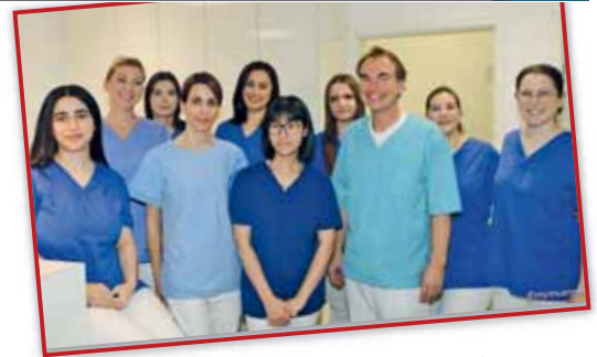
Das nette Team der Zahnarztpraxis Dr. Flaig.

Die Praxis ist ab dem 23.12. geschlossen, ab 07.01. sind wir wieder für Sie da!