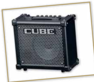
Verstärker Roland Cube 10GX

Rathausstraße 33 · 85757 Karlsfeld Telefon 08131-93998 · Mobil 0179-103 82 91