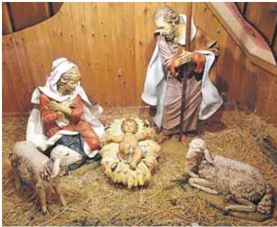
Christen feiern an Weihnachten die Geburt Christi im Stall zu Bethlehem.

MÜNCHEN (job) · Mit ein bisschen Wohlwollen kämen wir – als Verwandte, als Kollegen, als Bürger – trotz aller Auseinandersetzungen ganz gut miteinander zurecht. Nichts anderes meinen die Engel, wenn sie in der Weihnachtsnacht den Hirten »Frieden den Menschen, die guten Willens sind« verkünden. Vielleicht deswegen ist für manchen der Gottesdienst an Heiligabend der wichtigste im Jahr – und für viele der einzige. In dieser Ausgabe finden Sie dazu Termine in Ihrer Nähe. Wir wünschen Ihnen ein gesegnetes Fest. Mögen Ihnen viele Menschen guten Willens begegnen!