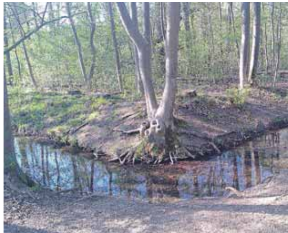
Das Hartmannshofer Bächl läuft aktuell nur noch über eine Strecke von etwa 3,5 Kilometer offen..

»Für die Maßnahme ist es erforderlich, im Vorfeld jetzt sieben Bäume umzusetzen«, teilt die Stadt in der Rathaus Umschau mit. Der Beginn der