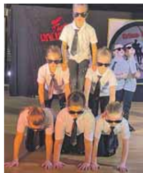
Die »Men in Black« der »Mimis« sind einfach nur cool.

50 Kinder und 20 erwachsene Tänzer, dazu viele Helfer hinter der Bühne, die für Technik, Kostüme, Licht, Haarstyling,