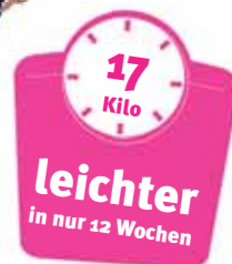
Ute Tautorius 86928 Hofstetten