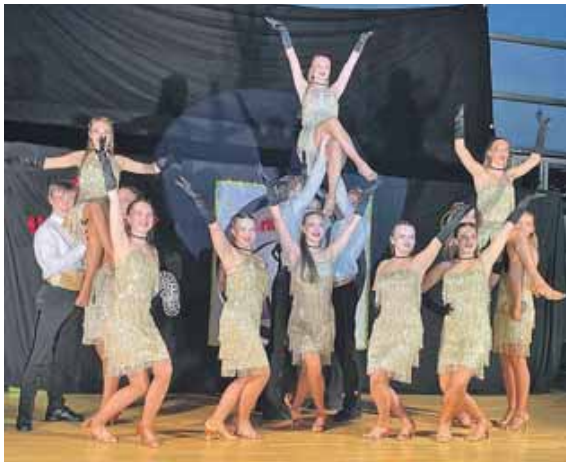
Glitzernde Kostüme und eine anspruchsvolle Choreographie präsentieren »Fun Unlimited« bei der Premiere.

Ihr Meisterbetrieb für Sanitär Heizung Wartung Notdienst