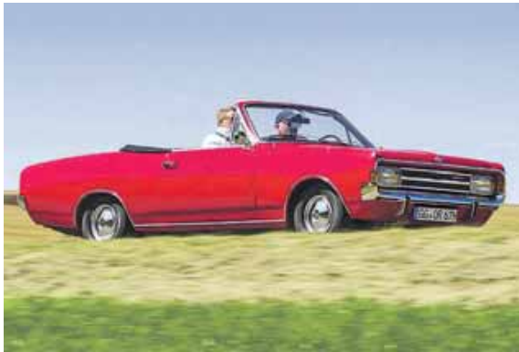
Vor der ersten Ausfahrt des Jahres mit dem Oldtimer ist eine Testfahrt ratsam.

(aum, red) · Im Frühjahr zieht es vermehrt auch wieder Oldtimerfahrer mit ihren automobilen Schätzen auf die Straße. Der Technikcheck nach der Winterpause sollte Pflicht sein. Aber auch der Fahrer selbst ist gefragt, denn in der Regel fehlt es im Old- oder Youngtimer an elektrischen Helferlein. Da gilt es, sich erst einmal wieder an das Fahren ohne Assistenzsysteme zu gewöhnen. So verfügen die rollenden Klassiker selten über einen Bremskraftverstärker. Zudem sind die Bremswege meist länger als bei heutigen Autos, mahnt die Gesellschaft für Technische Überwachung (GTÜ). Trommelbremsen verzögern nicht so spurtreu und gleichmäßig wie Scheibenbremsen und erst recht nicht, wenn sie durch Feuchtigkeit und Temperaturschwankungen Rost angesetzt haben. In