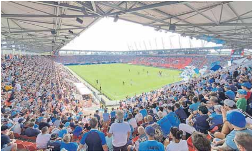
Heimspiel in Ingolstadt: Fans des TSV 1860 München.