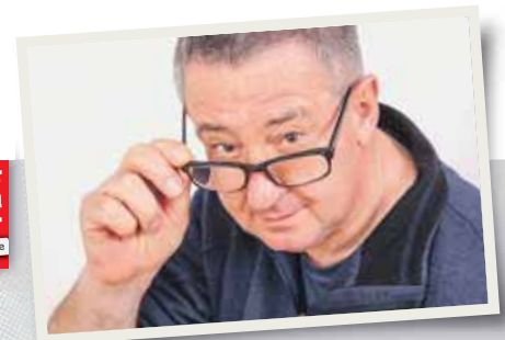
WIR SUCHEN ZUVERLÄSSIGE

KUNDENBERATER 40 €/Std. Haupt Nebenberuf! ☎ 089/2441153-19