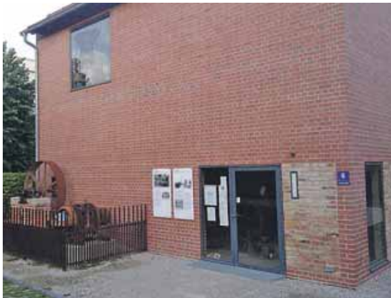
Das Maschinenhaus der Alten Ziegelei Oberföhring kann am Tag des offenen Denkmals besichtigt werden.

OBERFÖHRING (red) · Viele historische Bau- werke und Orte, die sonst nicht ohne weiteres oder nur teilweise für die Öffentlich- keit zugänglich sind, können alljährlich am zweiten Sonn- tag im September besichtigt werden – diesmal ist das der 8. September. Der »Tag des of- fenen Denkmals« macht dies möglich. Er ist das größte Kul- turevent Deutschlands und wird seit über 30 Jahren bun- desweit von der Deutschen Stiftung Denkmalschutz (DSD) koordiniert. Vor Ort sind es unzählige Ver- eine, Initiativen, Denkmalei- gentümer und hauptamtli-