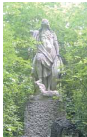
In Bogenhausen gibt es viel zu entdecken, wie zum Beispiel das Denkmal für Odin in der Odinstraße.

Bogenhausen und die angrenzenden Stadtteile sind durchzogen von Parks und Grünanlagen. Doch im Alltag bleibt oft unbeachtet, dass dort auch viele Denkmäler und Brunnen stehen oder sich schöne Ausblicke bieten. Auch Zeugen der »Lehm-Vergangenheit« des Münchner Nordostens sind hier noch zu finden. Die Teilnahme kostet für Nicht-Mitglieder. Den ge-