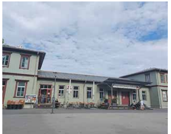
Vor dem Giesinger Bahnhof wird am 8. September gefeiert. Groß und klein sind eingeladen.

Big Band »Mikes Music Train« oder der Bernd Bauer Blues Band. Auf dem Platz gibt es Spielangebote, Tischtennis und Schach für Klein und Groß. To2 zaubert und verrät vielleicht ein paar Tricks. Zu jeder vollen Stunde können sich alle Interessierten im Kulturzentrum Giesinger Bahnhof den Bahnhoffilm ansehen. Gegen 16 Uhr führt dann Sebastian Wuttke, der Vorsitzende der Freunde Giesings, durch das Haus und beantwortet Fragen.