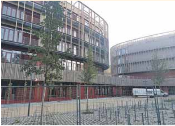
Der Neubau des Wilhelm-Hausenstein-Gymnasiums am Salzsenderweg wird zum neuen Schuljahr bezogen.

BOGENHAUSEN (red) · Am 10. September beginnt in Bayern das neue Schuljahr – und für das Wilhelm-Hausenstein-Gymnasium (WHG) bringt es einen echten Neuanfang mit sich: Die Schule zieht vom bisherigen Standort in der Elektrastraße in den Neubau am Salzsenderweg um.