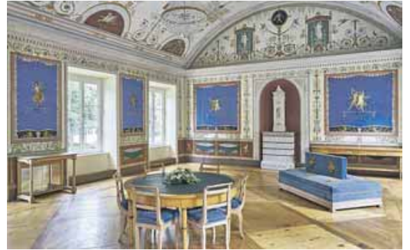
Auch die Prunksäle in Schloss Ismaning sind am Tag des offenen Denkmals für die Öffentlichkeit zugänglich.

Ganz zentral liegt in Ismaning das Schloss mit seinem schönen Schlosspark. Die ehemalige fürstbischöfliche Residenz