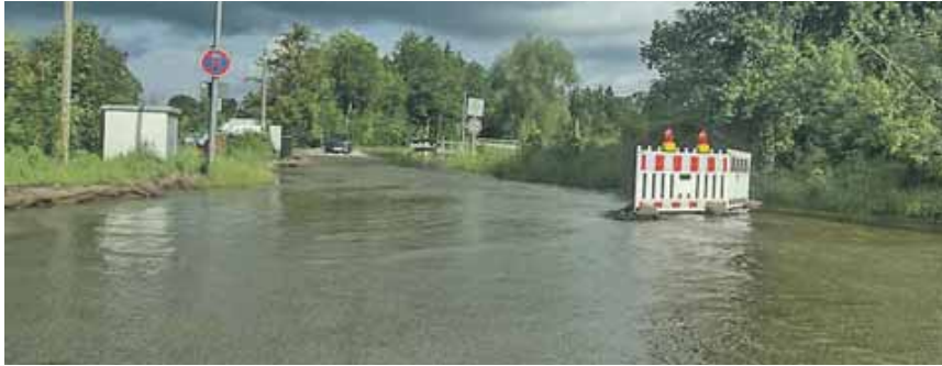
Bei Fahrten durch Hochwasser drohen Motor-, Batterie- und Elektronikschäden. Am besten ist es, bei Starkregen gar nicht erst loszufahren.

(Automobilclub KS, red) · Nach Hitzetagen schlägt das Wetter oft rasant um und Starkregen überflutet innerhalb von Minuten Unterführungen und tiefer gelegene Straßenbereiche oder Parkplätze. Auch können Bäche und Flüsse über die Ufer treten und angrenzende Bereiche überschwemmen. Wer Fahrten bei diesen Bedingungen vermeiden kann, lässt sein Auto am besten stehen. Was aber, wenn man bereits mit dem Auto unterwegs ist? »Idealerweise werden solche Gebiete weiträumig umfahren. Denn auch wenn Autos generell gut gegen jegliches Wetter geschützt sind: Beim Fahren durch stehendes Gewässer können der Motor, die Auspuffanlage, die Batterie oder