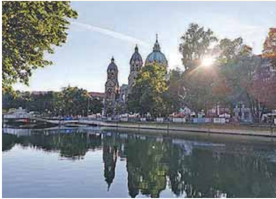
Das Isarufer zwischen Ludwigs- und Maximiliansbrücke wird drei Tage lang wieder zu einer bunten Fest- und Feiermeile für jedermann.

LEHEL (red) · Bereits zum 15. Mal verwandelt sich das Isargelände zwischen Ludwigs- und Maximiliansbrücke in eine bunte Festmeile. Von Freitag, 6., bis einschließlich Sonntag, 8. September, findet dort das Isarinselfest statt. Die Openair-Veranstaltung beinhaltet ein attraktives Musik- und Kulturprogramm und macht mit zahlreichen Konzerten und vielfältigen Aktionen das Isarufer zu einer bunten Festmeile. Los geht's am Freitag um 17 Uhr mit der Eröffnung durch den Veranstalter, den Isarinselfestverein. Übrigens hat auch dieses Jahr Oberbürgermeister Dieter Reiter die Schirmherrschaft für das Fest übernommen.