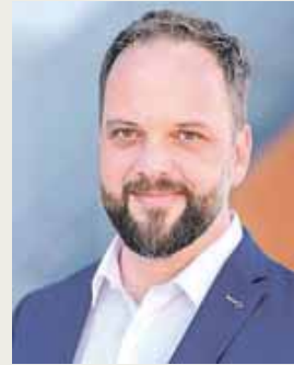
Oberbürgermeister Tobias Eschenbacher