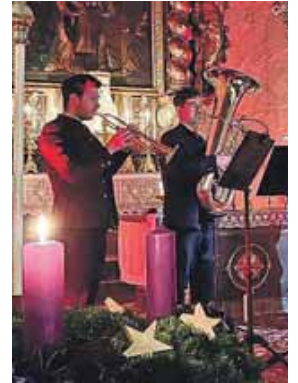
Die Musiker sammeln mit ihrem Konzert noch einmal Spenden für einen guten Zweck.