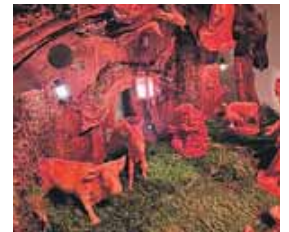
Noch beherbergt der Stall nur Tiere, die Heilige Familie wandert noch!