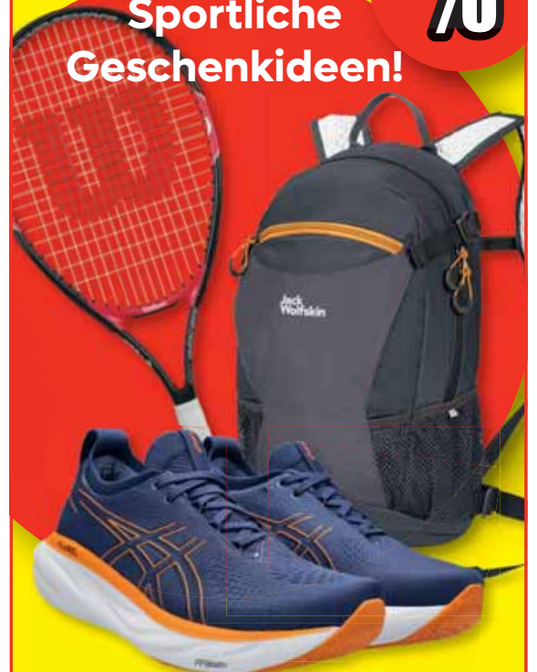
Abb. symbolisch – solange der Vorrat reicht

Raiffeisenstr. 29 | 85356 Freising-Attaching A92 Ausfahrt FS-Ost