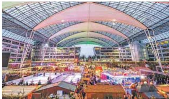
Dieses Mal kann man die Atmosphäre des Wintermarkts am Flughafen eine Woche länger genießen.

stimmungsvoller Atmosphäre durch die Buden bummeln, die Eisbahn nutzen oder Schmankerl genießen. Der Weihnachts- und Wintermarkt ist täglich von 11 bis 21 Uhr geöffnet – an Heiligabend und Silvester von 11 bis 16 Uhr und am Neujahrstag von 13 bis 21 Uhr. Weitere Informationen unter www.munich-airport.de/wintermarkt