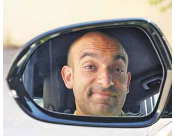
Django Asül blickt zurück auf 2023.

Das Fußballnationalteam leidet an wohlstandsverwahrloster Antriebsschwäche, der FC Bayern muss aus der Presse erfahren, dass sein Trainer gefeuert ist. Robert Habeck fliegt sein Heizungsgesetz um die Ohren. Eine Reform der Bundesjugendspiele soll Kinder vor Traumatisierung schützen.