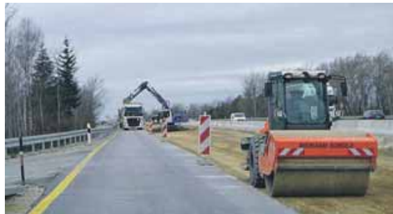
Die Baustelle auf der A 92 bei Moosburg stellt die Verkehrsteilnehmer auf eine harte Geduldsprobe.