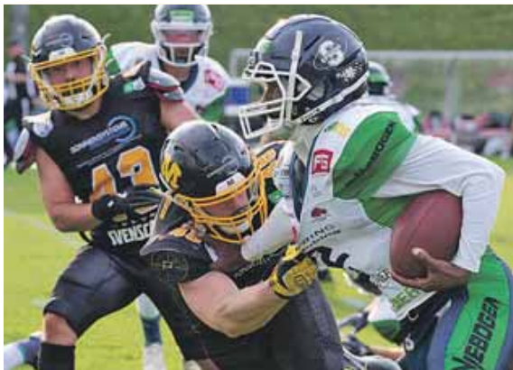
Die Munich Cowboys treten gegen die Straubing Spiders an.

Beide Teams wollen sich einen sicheren Spot in der Play-Off-Runde sichern und brauchen dafür unbedingt einen Sieg. Das Hinspiel in Straubing konnten die Cowboys mit 31:7 klar für sich entscheiden, allerdings haben sich die »Spinnen« aus Straubing während der Saison enorm gesteigert und stellen nun eine Herausforderung für die Cowboys dar.