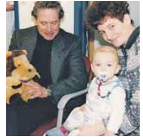
Michael Douglas scherzt mit Leukämiekindern in Sankt Petersburg.