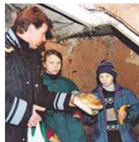
Patrick Lindner gibt Straßenkindern in Sankt Petersburg zu essen.