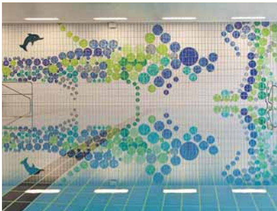
Im Bad Forstenrieder Park: Der Abriss steht bevor.

Von Stadtwerken und städt. Bildungsreferat wünscht sich der Bezirksausschuss im Münchner Süden eine bessere Abstimmung – die einen sind für die öffentlichen Bäder zuständig, das andere für die schulischen. Beide sollten enger zusammenwirken, um die Einschränkungen für die Bürger zu minimieren.