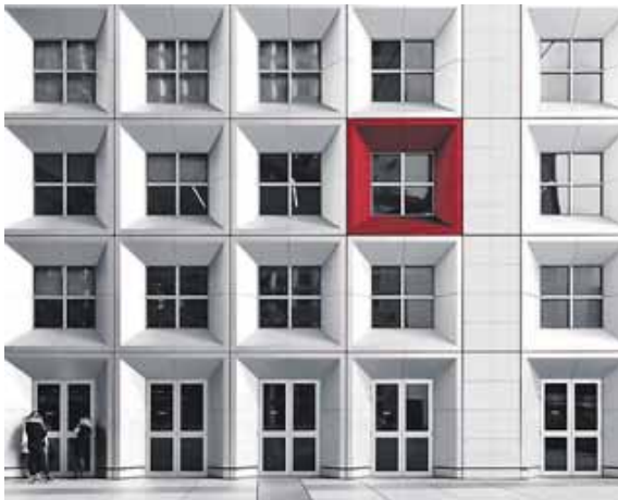
»The Red Frame« heißt dieses Werk von Regine Richter.

SENDLING (job) · Fassaden faszinieren und ziehen uns an: Sie erzählen Geschichten, spielen mit Licht und Farbe und lassen uns rätseln, was sich dahinter verbirgt. In der Ausstellung »Alles nur Fassade« in der Galerie eigenArt (MVHS am Harras) begibt sich Regine Richter in ihren Bildern auf die Suche nach der Ästhetik der Fassaden – von geometrischen Kompositionen bis hin zu farblichen Spannungen und inszeniert sie auf besondere Weise in hochwertigen Fine-Art-Drucken. Doch diese Ausstellung geht noch einen Schritt weiter: Einige der