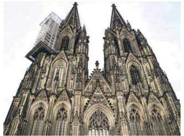
Der Dom zu Köln.

(CORRECTIV) · Auf Tiktok kursiert ein Video, das eine Großdemonstration in Köln für die AfD am Tag vor der Bundestagswahl 2025 zeigen soll. Doch die Aufnahmen stammen von einer Demonstration gegen Rechtsextremismus ein Jahr zuvor.