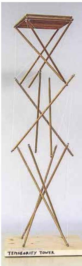
Die Jury würdigte den Tensegrity Tower als herausragendes Beispiel für modernes und nachhaltiges Bauen.