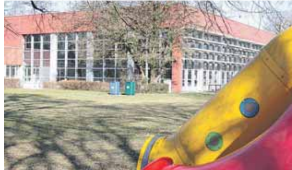
Seine Tage sind gezählt: Nach dem 11. April wird das Stäblibad (Bad Forstenrieder Park) geschlossen.

FORSTENRIED (job) · Das Stäblibad (Bad Forstenrieder Park) ist baufällig. Die Decke wurde schon vor längerem abgehängt, damit keine Teile auf die Menschen im Becken herabfallen können. Das Schwimmbecken selbst wird mit Balken gestützt. Am Freitag, 11. April, kann das 1976 eröffnete Bad letztmalig genutzt werden. Dann wird es geschlossen, abgerissen und später neu gebaut. Das alles wird indes viel mehr Zeit brauchen als ursprünglich gedacht.