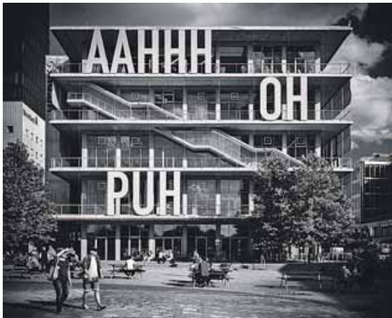
»AAHHH, OH, PUH«: Regine Richter inszeniert Architektur.

Regine Richter versteht es meisterhaft, durch klare Linien, auffällige Farbkombinationen und außergewöhnliche Perspektiven neue Blickwinkel auf die Architektur zu