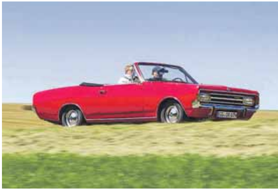
Vor der ersten Ausfahrt des Jahres mit dem Oldtimer ist eine Testfahrt ratsam.

(aum, red) · Im Frühjahr zieht es vermehrt auch wieder Oldtimerfahrer mit ihren automobilen Schätzen auf die Straße. Der Technikcheck nach der Winterpause sollte Pflicht sein. Aber auch der Fahrer selbst ist gefragt, denn in der Regel fehlt es im Old- oder Youngtimer an elektrischen Helferlein. Da gilt es, sich erst einmal wieder an das Fahren ohne Assistenzsysteme zu gewöhnen. So verfügen die rollenden Klassiker selten über einen Bremskraftverstärker. Zudem sind die Bremswege meist länger als bei heutigen Autos, mahnt die Gesellschaft für Technische Überwachung (GTÜ). Trommelbremsen verzögern nicht so spurtreu und gleichmäßig wie Scheibenbremsen und erst recht nicht, wenn sie durch Feuchtigkeit und Temperaturschwankungen Rost angesetzt haben. In