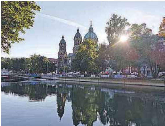
Das Isarufer zwischen Ludwigs- und Maximiliansbrücke wird drei Tage lang wieder zu einer bunten Fest- und Feiermeile für jedermann.

Isarinsselfest lädt an der Steinsdorfstraße zum Genießen ein