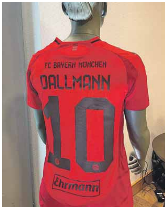
Der Ehrmann-Schriftzug zielt in der neuen Saison die Rückseite des Trikots der FC Bayern Frauen.

der Ehrmann GmbH betont: »Wir sind sehr stolz, künftig Partner des FC Bayern zu sein. Unser Leitsatz lautet: ‚Von der