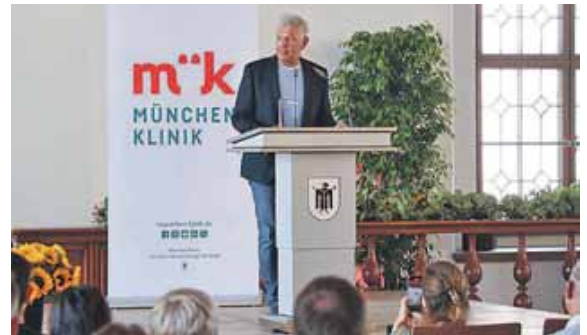
Oberbürgermeister Dieter Reiter lobte die Leistungen der Pflege-Absolventen und betonte die Wichtigkeit dieses Berufes für die Gesellschaft.

Die neuen Pflegefachfrauen und Pflegefachmänner sind der zweite Jahrgang mit einem Abschluss in der im Jahr 2020 neu eingeführten generalistischen Pflegeausbildung.