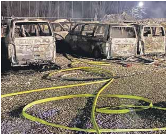
23 Autos der Diensthundestafel brannten vollständig aus.

UNTERMENZING (job) · Nach dem mutmaßlichen Brandanschlag auf die Diensthundestafel in der Nacht auf Samstag (25. Januar) sucht die Polizei Personen, die dazu sachdienliche Angaben machen können. Sie werden gebeten, sich mit dem ermittelnden Kriminalfachdezernat 4, Tel. 089/2910-0, oder einer anderen Polizeidienststelle in Verbindung zu setzen.