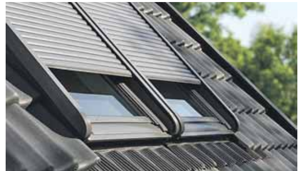
Rundum-Schutz für Dachfenster mit Rollläden.

Doch Vorsicht: Große Fensterflächen unterm Dach sind schön, doch können sie ganz ohne Sonnenschutz die darunter liegenden Räume auch unnötig stark erwärmen. Wer nicht auf Tageslicht verzichten möchte, für den bieten sich z.B. Hitzeschutz-Markisen mit transparentem Stoff an. Trotzdem fällt noch genügend Tageslicht in den Raum und auch der Blick durch das Dachfenster in die Umgebung ist möglich. Rundumschutz für Dachfenster bieten Rollläden für's Dachfenster.