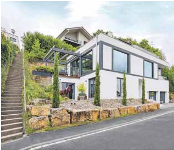
Vor allem bei Grundstücken in Hanglage sollten Bauherren von Anfang an auch über eine Alternative mit Wohnkeller nachdenken.

gangsplanung mit Keller später vermieden und schöne Gartenfläche erhalten werden. Auch eine Bodenplatte, so sie denn fachmännisch geplant und realisiert wird, oder eine Teilunterkellerung können je nach Baugrund und persönlichem Wohnraum-Bedarf passende Lösungen sein. »Es ist wichtig, beim Hausbau von unten nach oben zu planen sowie Kosten und Nutzen verschiedener Möglichkeiten frühzeitig und fundiert gegeneinander abzuwägen, damit das Bauvorhaben ein voller und dauerhafter Erfolg wird«, so der Kellerexperte. Gerade ein Hausbau am Hang lädt heute dazu ein, typische Grundrisse mit Gemeinschaftsfläche im Erdgeschoss und Schlafräumen und Badezimmer im Obergeschoss neu zu denken viele Bauherren fahren günstiger damit, sich für ein kleineres Grundstück, dafür aber für einen Hausbau mit Keller zu entscheiden, statt für ein großes Grundstück und ein Haus ohne Keller«, schließt Braun.