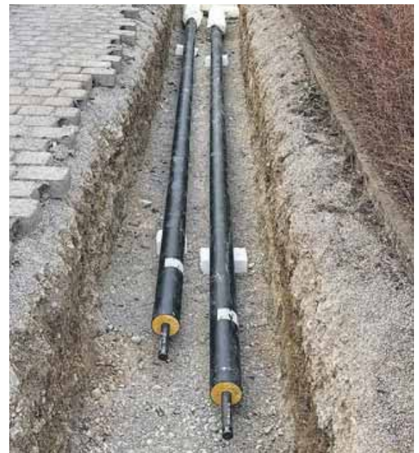
Die Leitungen für die Fernwärme liegen bereits im Erdreich.