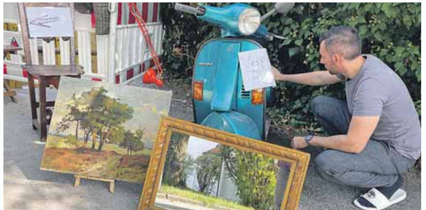
Kunst und Krempel – beim Gilchinger Garagenflohmarkt wechseln die Speicherschätze ihre Besitzer.

Gemeinde. Wer mitmachen möchte, wirft ein Briefkuvert mit zehn Euro in den Briefkasten in der Sankt-Egidistraße 15a. Darauf sollten Name, Anschrift und die Emailadresse vermerkt sein. Mehr Informationen stehen unter gilchinger-garagenflohmarkt.de und auf Facebook. Falls es regnet, gibt es einen Ausweichtermin am Sonntag, 25. Mai, von 9 bis 16 Uhr.