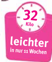
Markus Mühlbauer 80997 München