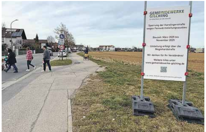
Die Schilder weisen bereits auf die nächste Großbaustelle für das Fernwärmenetz hin.

Netzausbau für die Fernwärme geht weiter