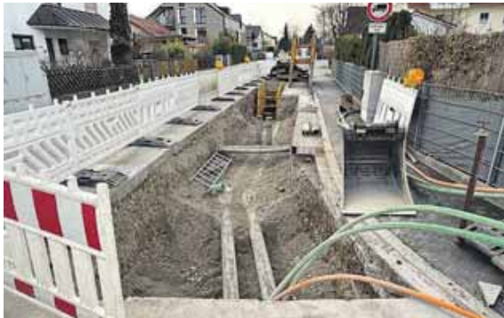
Strom, Wasser, Wärme – unter dem Straßenbelag liegen die unterschiedlichen Leitungen.

GILCHING (pst) · Ein paar Tage lang können die Gilchinger durchschnaufen, nachdem die Vollsperrung der Landsberger Straße zwischen der James-Krüss-Grundschule und der Straßenmeisterei aufgehoben wurde. Die Bauarbeiten für das Fernwärmenetz sind zwar in diesem Bereich beendet, doch es geht unvermindert weiter. Die Schilder, die über die kommenden Baustellen aufklären, stehen bereits. Darunter sind wieder größere Verbindungsstraßen.