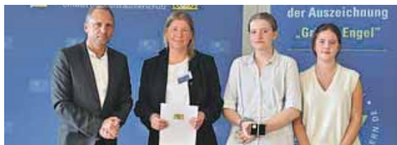
Das Bayerische Staatsministerium für Umwelt hat die EmiLe Montessorischule für ihren besonderen Einsatz in Sachen Umwelt ausgezeichnet.

Teilnahme am Stadtradeln oder der EmiLe-Kleiderbasar. Auch als Bildungsakteure ist die Schule vielfach im Einsatz: bei Schulveranstaltungen, beim Umwelttag der Gemeinde Neubiberg oder beim Day of Hope, der Projektbörse der Umweltschulen. Hier konnte die EmiLe erstmals Kontakt mit dem Jane Goodall Institut aufnehmen. Inzwischen ist die Schule auch offiziell aufgenommen in das Roots & Shoots Netzwerk. Die EmiLe setzt ihren Fokus auf verschiedenste Projekte zur Umweltbildung und die nachhaltige Gestaltung einer lebenswerten Zukunft. So können die Schüler_innen ihre Potentiale entfalten und die Wirksamkeit ihres Handelns erfahren, damit sie die Welt von morgen verantwortungsvoll, kreativ und selbstbewusst mitgestalten können. V