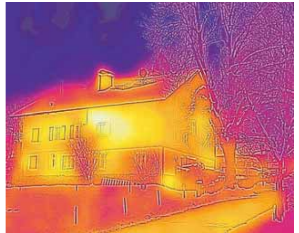
Spaziergang mit neuen Ansichten: So sieht beispielsweise der Blick durch die Wärmebildkamera aus.

Beginn ist jeweils um 16 Uhr. Treffpunkt am 24. Januar ist an der Bushaltestelle Oderdinger Straße/Ecke St. Anna-