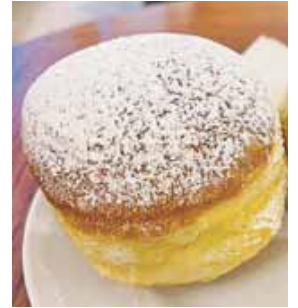
Was wäre Fasching ohne köstliche Krapfen?!

Otterfing: Am Samstag, 22. Februar, geht es in Otterfing mit dem berühmt-berüchtigten Vesuvball des Otterfing Burschenvereins weiter. Der Einlass ist ab 18 Jahren (Ausweiskontrolle). Der Eintritt kostet 12 Euro. Los geht es um 20.00 Uhr, der Einlass erfolgt ab 19.30 Uhr. Karten gibt es an der Abendkasse, gefeiert wird bis 5 Uhr morgens. Am Freitag, 28. Februar, lädt der Frauenbund zum Crazy Friday ab 20.00 Uhr ein, dort wird wieder ein humorvolles Theaterstück gezeigt. Eine Tombola gibt es natürlich