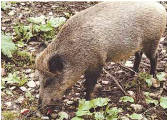
Täglich um 16 Uhr findet im Walderlebniszentrum Grünwald eine Wildschweinfütterung statt. Der Eintritt ist frei.

GRÜNWALD (hw) · Das Walderlebniszentrum Grünwalder Sauschütt feiert in diesem Jahr seinen stolzen 30. Geburtstag und hat sich deshalb jeden Monat ganz besondere Schmankerl für seine Gäste ausgedacht. So findet beispielsweise neben den zahlreichen Angeboten für Familien und Kinder am Freitag, 28. März, eine Nachtwanderung mit Lagerfeuer von 19.30 bis 22.00 Uhr statt oder am Sonntag, 6. April, von 14.00 bis 16.00 Uhr ein Spaziergang durch den Forst unter dem Motto: »Wald und Wild«. Das komplette Angebot findet man unter www.walderlebniszentrum-gruenwald.de