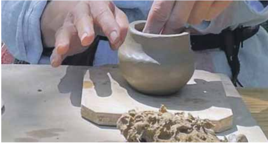
Ein Kunstworkshop wird für Menschen mit beginnender Demenz in Taufkirchen angeboten.

Kurs für Menschen mit beginnender Demenz