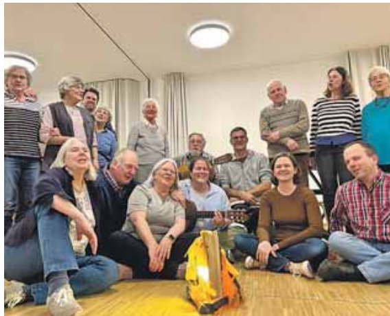
Start des Eröffnungswochenendes am virtuellen Lagerfeuer mit viel Musik.

LOCHHAUSEN (us) · Drei Jahre lang war die evangelische Gemeinde in Lochhausen ohne Heimat. Der 2022 abgerissene Gemeindesaal St. Bartimäus wich in den vergangenen Jahren einem Gebäudekomplex mit vier kleinen Häusern, in die nun vorwiegend alleinerziehende Frauen und ihre Kinder in Wohnungen und Wohngruppen eingezogen sind. Insgesamt 6,1 Millionen Euro hat der Komplex der evangelischen Landeskirche gekostet. Das Herzstück des Ensembles ist der Gemeindesaal. Mit rund 80 Quadratmetern, einer Trennwand, Küche und