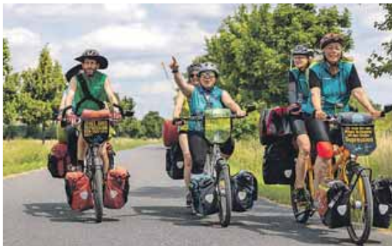
Mit dem Tandem durch Deutschland.

FREISING (chö) · Die MUT-TOUR setzt sich für mehr Offenheit im Umgang mit Depressionen und psychischen Erkrankungen ein. Auch 2025 wird die deutschlandweite Tour wieder stattfinden – auf Fahrrad Tandems und wandernd quer durch das Land. Ziel ist es, durch Bewegung, Begegnung und Gespräche für das Thema zu sensibilisieren und zu zeigen: Psychische Erkrankungen sind kein Tabu und verdienen die gleiche Aufmerksamkeit wie körperliche.