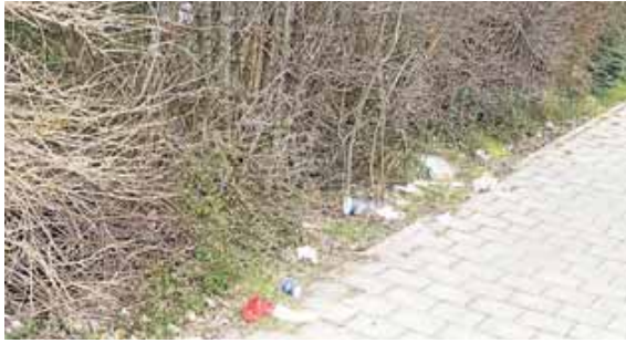
Diese Bilder könnte man in Freising durch eine Verpackungssteuer vermeiden.

Bereits im Juli 2023 hat die Fraktion der ÖDP im Freisinger Stadtrat den Antrag auf Einführung einer Verpackungssteuer gestellt. Warum seither gar nichts passiert ist, das kann sich eigentlich keiner erklären. »Auch aus unserer Sicht ist eine diesbezügliche Entscheidung jetzt auf alle Fälle schnellstens erforderlich«, sagt Hartmut Binner von der ÖDP. Nun hat sich