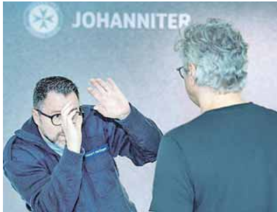
Sich im Ernstfall schützen, darum geht es in diesem Kurs.

LANDKREIS (chö) · Gewalt und Aggression im Alltag oder Beruf sind Themen, die viele Menschen betreffen. Wie man mit solchen Situationen souverän umgeht und sich im Ernstfall schützt, vermittelt der neue Kurs »Sicher kommunizieren – wirksam verteidigen« (SIKO) der Johanniter-Unfall-Hilfe im Regionalverband Oberbayern. Effektive Deeskalation und Selbstschutz erlernen. Der siebenstündige Workshop vermittelt praxisnahe Methoden zur Konfliktbewältigung, Deeskalation und Selbstverteidigung. Neben der theoretischen Auseinandersetzung