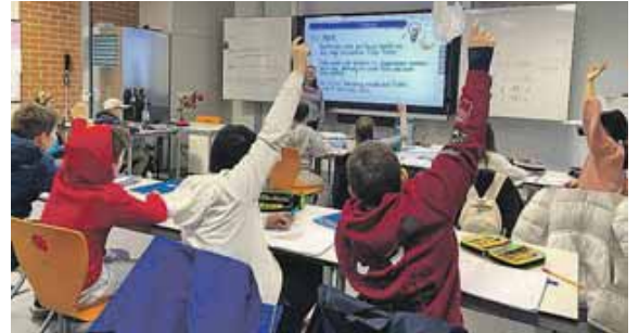
Tag der offenen Tür in der Wirtschaftsschule Freising.

FREISING (chö) · Die Staatliche Wirtschaftsschule Freising bietet Schülerinnen und Schülern ab der 5. Jahrgangsstufe eine wertvolle Alternative zu Realschule und Gymnasium. Seit Jahrzehnten werden hier mit großem Erfolg kaufmännische Nachwuchskräfte ausgebildet, die in den Betrieben der Region hochgeschätzt werden. Durch den Besuch der Wirtschaftsschule verkürzt sich in vielen kaufmännischen Berufen die Ausbildungszeit um bis zu einem Jahr. Doch nicht nur in der Wirtschaft, auch im Handwerk genießen die Absolventinnen und Absolventen der Staatlichen Wirtschaftsschule Freising einen ausgezeichneten Ruf. Ganz nach dem Motto: »Handwerk hat goldenen Boden! – Mach was aus dir! Vergolde deine Zukunft.« Zudem öffnet der Wirtschaftsschulabschluss die Türen zum Besuch der Fachoberschule (FOS). Mit einem neuen, er-