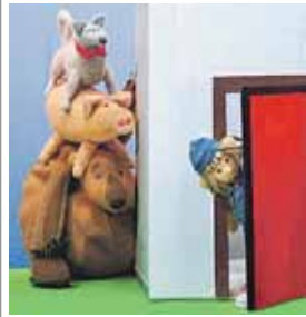
Das Theater Pantaleon war Gast in Freising.

Vor und nach der Aufführung gibt es ein Eltern-Kind-Cafe mit thematischer Bastelaktion. Karten zu 8 Euro können im Jugendzentrum telefonisch reserviert werden unter 08161/54-45353, mittwochs bis samstags von 15 bis 19 Uhr.