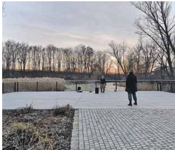
Hier im Bürgerpark findet am Samstag die Veranstaltung statt.

Eingeladen sind alle, die sich für eine menschliche und offene Gesellschaft einsetzen möchten. Die Veranstalter hoffen auf eine rege Teilnahme und möchten zeigen, dass Langenbach ein Ort des Miteinanders bleibt.