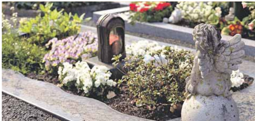
Die Trauer jedes Einzelnen sieht anders aus.

Für Trauernde sind Feiertage seit jeher eine Herausforderung. Wer den Verlust eines geliebten Menschen verarbeitet, der fühlt sich im üblichen Rummel und angesichts der