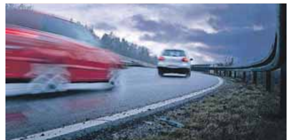
Sicher ans Ziel kommen, auch bei kritischen Witterungsbedingungen.

(djd) · Nebel und Nässe, Schnee und Glatteis: In der kalten Jahreszeit sollten Autofahrer auf alles vorbereitet sein. Besonders tückisch sind Temperaturen, die um den Gefrierpunkt pendeln und somit von einer Sekunde auf die andere für vereiste Oberflächen sorgen können. Da hilft nur eines: Fuß vom Gas nehmen. Gefragt ist eine vorausschauende, umsichtige Fahrweise, schließlich können sich die Beschaffenheit der Fahrbahn und somit die Haftung zwischen Reifen und Straße jederzeit verändern. Um sicher ans Ziel zu kommen, sollte man nur behutsam Gas geben und ruckartige, hektische Lenkbewegungen vermeiden. Eine Selbstverständlichkeit sind zudem Räder, die der Witterung angepasst sind, also Winterreifen oder Ganzjahresreifen.