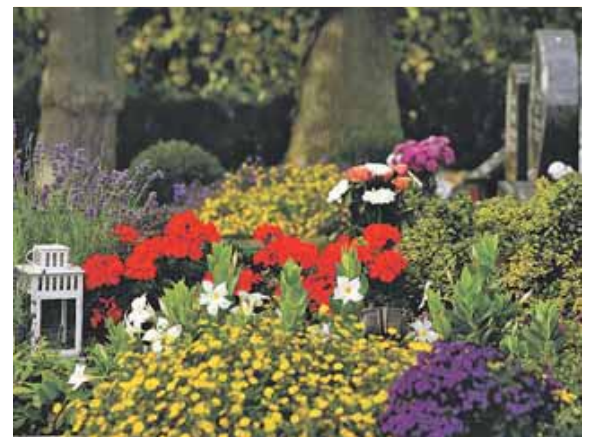
Jeder hat ein Recht auf einen persönlichen Abschied.

Die Antworten auf diese Fragen kann jeder nur selbst geben. Dass diese Feststellung uns heute selbstverständlich scheint, dokumentiert ein Stück weit den Wandel unserer Bestattungs- und Trauerkultur. Gerade jetzt fühlen wir, dass Sterben und Abschiednehmen zum Leben dazugehören – und dass jeder ein Recht auf einen persönlichen Abschied hat.