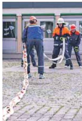
Übung der Jugendfeuerwehr Lkr. FS für die Leistungsspange

schen Jugendfeuerwehr abgenommen. Auch die Teilnahme an Wettbewerben, wie dem Bundeswettbewerb oder dem internationalen Wettbe-