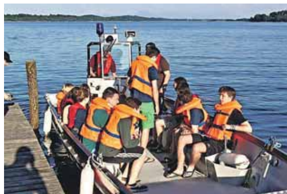
Übung, Gemeinschaft und Spaß – das zählt bei der Jugendfeuerwehr.

Der Dank gilt vor allem den Jugendwarten und Betreuern, die mit großem Einsatz und Engagement den Jugendlichen dieses vielfältige und wichtige Hobby näherbringen. Ihr Einsatz sichert die Zukunft der Freiwilligen Feuerwehren im Landkreis Freising – und damit die Sicherheit aller Bürger.