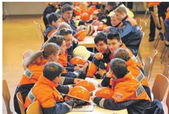
Starke Gemeinschaft: Die Jugendlichen beim »Flammenlauf«.

FREISING (chö) · Ob Brand, Verkehrsunfall, Naturkatastrophe oder andere Notfälle – die freiwilligen Feuerwehren sind immer zur Stelle. Im Landkreis Freising können die Bürger auf einen starken Feuerwehrverband zählen. Der Kreisfeuerwehrverband Freising e.V. wurde am 21. Juni 1995 neu gegründet und umfasst heute 82 Freiwillige Feuerwehren, drei Werksfeuerwehren und 42 Jugendfeuerwehren. Insgesamt engagieren sich 3.635 ehrenamtliche Helfer im Verband, darunter 380 Jugendliche.