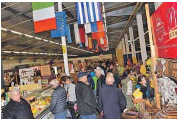
Beim Bauernmarkt gibt es Kulinarik aus aller Welt.

ECHING (chö) · Auf dem Gelände von Möbel Biller öffnet der 14. Europäische Bauernmarkt seine Pforten. Internationale Aussteller präsentieren hier ihre regionalen Spezialitäten, die Besucher aus aller Welt anlocken. Dieser besondere Markt bietet nicht nur eine reichhaltige Auswahl an kulinarischen Genüssen, sondern auch ein vielfältiges Rahmenprogramm, das für die ganze Familie geeignet ist. Die Vielfalt der angebotenen Produkte reicht von traditionellen Käse- und Wurstspezialitäten bis hin zu erlesenen Weinen und handwerklich gefertigten Produkten. Hier können die Besucher den Geschmack verschiedener europäischer