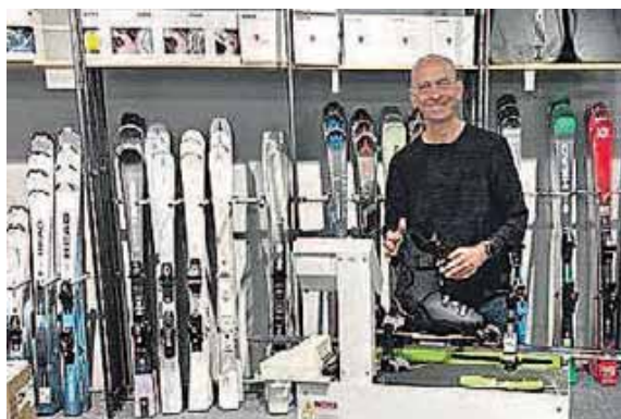
Das Team bietet einen umfassenden Ski-Service von A bis Z an.

vices ist das Kantenschleifen. Ebenso wichtig für die Sicherheit auf der Piste ist die Einstellung der Skibindung. Neben Ski- und Snowboard-Services bietet Sports Freising auch das Schlittschuhschleifen an. Scharfe Kanten sorgen für sicheres und agiles Gleiten auf dem Eis – ein Muss für jeden Schlittschuhläufer. Unter dem Motto »Ski Ready« stellt Sports Freising sicher, dass Ski, Snowboards und Schlittschuhe perfekt vorbereitet sind. Egal, ob Kunden frisch verschneite Hänge erobern, auf Langlaufloipen gleiten oder einfach nur Eislaufen möchten – hier ist das Equipment in besten Händen.