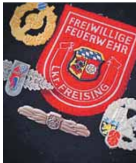
Logo der Freiwilligen Feuerwehren im Landkreis mit diversen Abzeichen.

Auch praktische Ausbildung und spannende Erlebnisse kommen nicht zu kurz: Ob Fahrertraining in Zusammenarbeit mit dem ADAC oder Ausflüge in den Europapark, bei