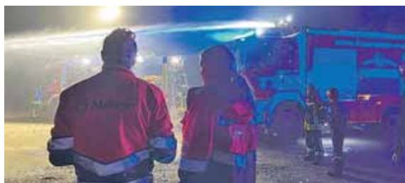
Beim gemeinsamen 24-Stunden-Übungstag stellten Jugendfeuerwehr und Malteser Jugend ihre Kenntnisse unter Beweis.

Wer Interesse hat, Teil dieser wichtigen Gemeinschaft zu werden und sich für den Schutz und die Sicherheit der Bürger einzusetzen, ist herzlich eingeladen, sich bei der örtlichen Jugendfeuerwehr zu melden. Hier wartet ein abwechslungsreiches und sinnstiftendes Hobby, das nicht nur die eigene Zukunft, sondern auch die der Freiwilligen Feuerwehren sichert.