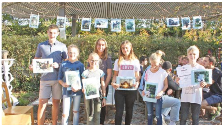
Das sind die Vorjahressieger des Wettbewerbes.

Bei den Einsendungen ist darauf zu achten, dass neben dem Namen, der Adresse und dem Alter der Fotografen auch möglichst eine kleine