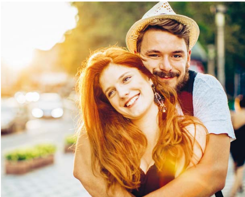
Das junge Paar lebt streng vegan und hat an diesem Grundsatz auch bei der Entwicklung ihrer Deodorant-Serie festgehalten.

wenn einem das eigene Wohlergehen wichtig ist. Denn Aluminiumsalze in Kosmetika stehen im Verdacht, eine gesundheitsschädliche Wirkung zu haben und beispielsweise das Risiko von Brustkrebs zu erhöhen. Stattdessen kommt der naturbelassene Wirkstoff Bicarbonat zum Einsatz, der auch als Backnatron bekannt ist. Er sorgt zuverlässig dafür, dass die Keimbildung und damit die Entstehung von unangenehmem Schweißgeruch reduziert wird, während Pfeilwurz schweißbedingte Nässe absorbiert und somit optimale Wohlfühl-Trockenheit garantiert. Die Deos sind sowohl in neutralen als auch in Duftvarianten erhältlich. Denn neben ihrer Wirkkraft und der veganen, ICA-DA-zertifizierten Herstellung – sämtliche Inhaltsstoffe sind zu 100 Prozent natürlichen Ursprungs – überzeugen die Naturkosmetik-Produkte insbesondere durch ihren frischen, natürlichen Duft.