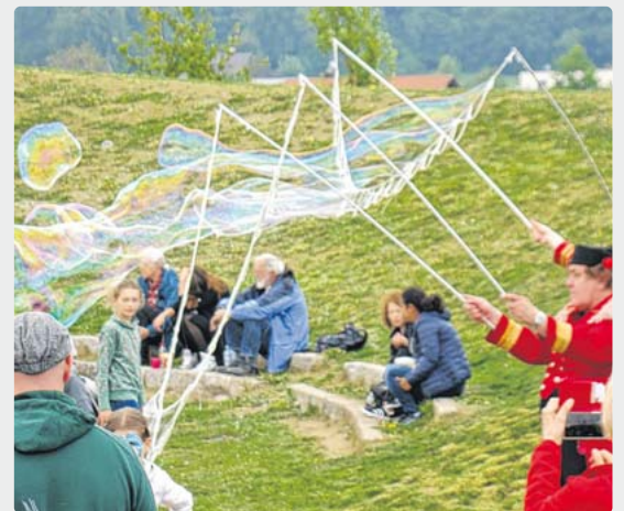
pst / Bild: pst

Gilching · Mit einem großen Fest verabschiedet der Abenteuerspielplatz (ASP) der Gemeinde an der Gilchinger Frühlingstraße 16 den Sommer. Am Freitag, 20. September sind alle Kinder von 15 bis 18 Uhr eingeladen. Es erwartet sie ein Stationslauf, bei dem sie Geschicklichkeit beweisen müssen, eine Hüpfburg, verschiedene Bastelangebote und vieles mehr.