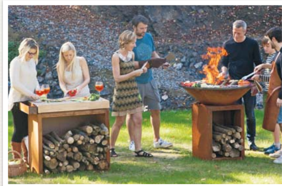
Jeder packt mit an bei der Gartenparty.

Bei der Zubereitung gibt es viele Möglichkeiten: Das Essen kann direkt auf der Stahlplatte, in einer Pfanne oder auf Zedernholz-Brettchen, ohne schädlichen Ruß und Rauch, gegart und gebraten werden. Daher ist dieses Outdoor-Kochkonzept auch für Gemüsegerichte besonders geeignet. Traditionell kann auch auf dem Grillrost Fleisch zubereitet werden. Informationen, einen Online-Shop und ein Händlerverzeichnis gibt es unter www.ofyr.de . Die Reinigung ist denkbar einfach. Essensreste und Fette werden ganz einfach mit dem Spachtel ins Feuer geschabt.