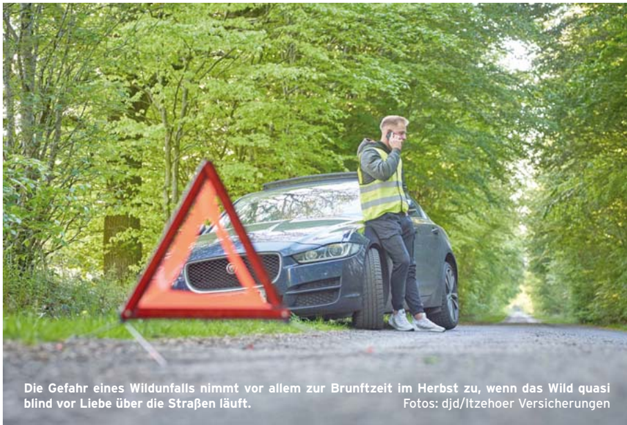
Die Gefahr eines Wildunfalls nimmt vor allem zur Brunftzeit im Herbst zu, wenn das Wild quasi blind vor Liebe über die Straßen läuft.

Wildunfälle vermeiden und sich nach einem Unfall richtig verhalten