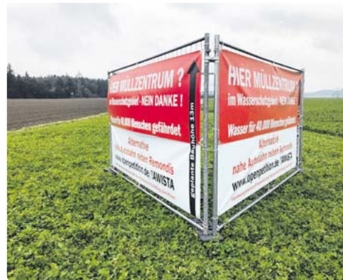
Auf dieser Wiese möchten die Weßlinger keine Müllumladestation.

Als Begründung für den Widerstand der Weßlinger hieß es auf der Seite der offenen Petition: Die Gemeinde Weßling habe einen Alternativstandort für die AWISTA-Müllumladestation nördlich der Lindauer Autobahn „An den Gruben“ angeboten. Eine AWISTA-Müllumladestation zwi-