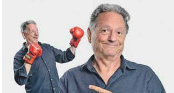
Der Kabarettist Günter Grünwald ist am 20. Juli zu Gast in Putzbrunn.

Tickets gibt es bei allen München-Ticket-Vorverkaufsstellen sowie – falls noch vorhanden – an der Abendkasse mit Einlassöffnung um 19:00 Uhr.