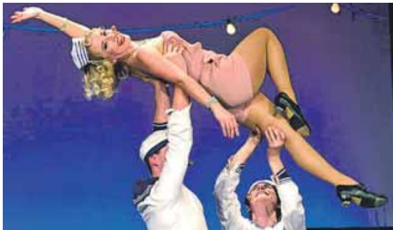
Die Musical Night im Wolf-Ferrari-Haus verspricht unterhaltsame Stunden.

Die Preise der Abonnements bewegen sich zwischen 72 und 83 Euro für je vier Vorstellungen. Das Wolf-Ferrari-