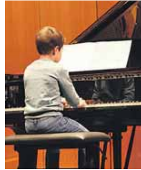
Die jungen Pianisten zeigen bei ihrem Konzert was sie gelernt haben.

NEUBIBERG (red) · Seit vielen Jahren ist das Konzert »Junge Pianisten« der Musikschule Unterhaching e. V. ein fester Termin, auf den sich die Lehrer*innen des Fachbereichs Klavier unter der Leitung von Maryam Sedghi freuen. Und mit ihnen die Schüler*innen und ihre Familien. Für die Anfänger ist es eine erste Möglichkeit, Erfahrungen im Vorspiel zu sammeln und den Eltern zu zeigen, wieviel sie schon gelernt haben. Während die Schüler im zweiten und dritten Jahr bereits teilweise kammermusikalisch auftreten und für die Jüngeren Inspiration und Motivation zugleich sind. Ein großer Teil der jungen Pianisten legt auch eine freiwillige Prüfung ab und darf bei bestandener Prüfung die Urkunde gleich mitnehmen. Am Ende des Konzertes