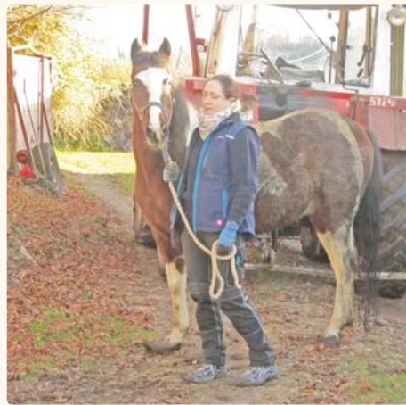
Viel Einfühlungsvermögen: Die Tierschutzinspektoren beruhigten das verängstigte Tier und konnten es dann sicher verladen.

Der 14-jährige Wallach, der von oben bis unten mit Schmutz und Fäkalien verklebt war, fristete offenbar bereits seit einhalb Jahren alleine in einer Einzelbox sein trauriges Dasein. „Seine Hufe waren schon so lang, dass sie sich nach vorne aufrollten. Deshalb und aufgrund von Muskelschwund nach jahrelangem Bewegungsmangel konnte der arme Kerl kaum mehr laufen. Die letzte tierärztliche Versorgung lag bereits acht Jahre zurück“, schreibt der Tierschutzverein in einer Pressemitteilung. Die Tierschutzinspektoren brachten Jacky zunächst in eine Pferdeklarin, wo er medizinisch versorgt, gewaschen und durchgecheckt wurde. Seine Hufe