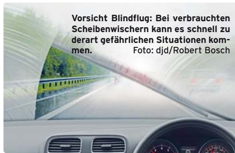
Vorsicht Blindflug: Bei verbrauchten Scheibenwischern kann es schnell zu derart gefährlichen Situationen kommen.

gleichzeitig die Technik auf Herz und Nieren zu überprüfen - so lässt sich manch ärgerliche Panne vermeiden. Viele Werkstätten, wie beispielsweise die Bosch Car Service Betriebe, bieten einen speziellen Rundum-Check für Herbst und Winter an. Batterie, Bremsanlage, Motor, Scheibenwischer und vieles mehr werden dabei kontrolliert - und bei Bedarf gleich ausgetauscht.