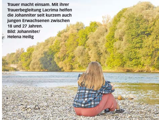
Trauer macht einsam. Mit ihrer Trauerbegleitung Lacrima helfen die Johanniter seit kurzem auch jungen Erwachsenen zwischen 18 und 27 Jahren.