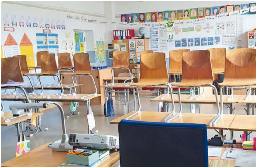
Lesen Sie weiter auf Seite 7 Stühle oben, keine Schüler, kein Unterricht: So wird es in den bayerischen Klassenzimmern heuer schon nach dem letzten Schultag am 18. Dezember aussehen.

München - Bayerns Schüler gehen früher in die Weihnachtsferien: Letzter Schultag ist nicht der 22. Dezember, sondern schon Freitag, 18. Dezember. Das haben Ministerpräsident Markus Söder und Kultusminister Michael Piauzolo festgelegt. Sie hoffen, dass das Infektionsrisiko durch die nun fast einwöchige Zeit zwischen Unterricht und Weihnachten gesenkt wird. „Damit verbessern wir die Möglichkeiten, dass die Familien das wichtigste Fest des Jahres gesund feiern können“, so Söder. Er mahnte gleichzeitig zu Vorsicht: „Treffen mit der Familie: ja. Treffen im kleinen Kreis: gerne!“ Die Ferien dürfen keine neue Infektionsgefahr werden.