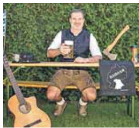
Der Musikkabarettist Vogelmayer ist am 30. März zu Gast in Perlach.

PERLACH (red) · Der bayerische Kabarettist Vogelmayer tritt am Sonntag, 30. März mit seinem Kabarettprogramm im Gasthaus »Der Hufnagel« auf (Ottobrunner Str. 135) auf. Einlass ist um 17 Uhr. Beginn um 18 Uhr. Der Eintritt ist frei. Reservierung bitte unter tel. 089/67.974.242.