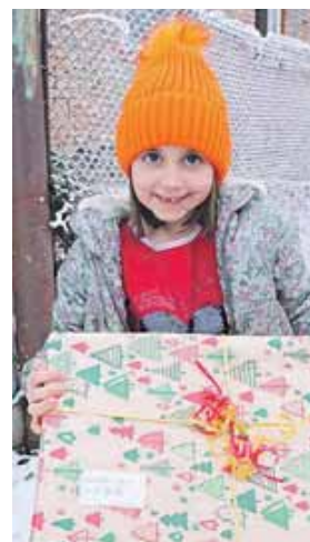
Die mit viel Herz gepackten Päckchen gehen an Kinder in Osteuropa.

Vom 25. Oktober bis 25. November 2024 werden von Menschen aller Altersgruppen Päckchen gepackt – von Familien, Einzelpersonen, Schulen, Kindergärten, Vereinen bis hin zu Unternehmen. Teilnehmen ist einfach: Jeder kann