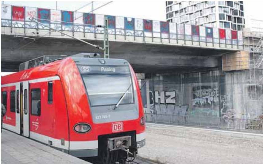
Unter der Brücke am S-Bahnhof stören die Schmierereien. Die Bürgergremien können sich hier eine professionell gestaltete Wandbemalung vorstellen