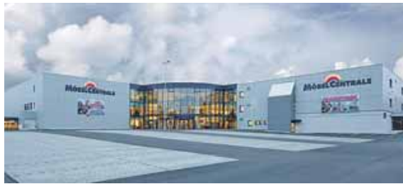
Die Möbel Centrale an den Standorten Schongau und Penzberg feiert Jubiläum.

SCHONGAU · Die Möbel Centrale in der Gogoliner Str. 3-5 feiert ein bemerkenswertes Jubiläum: 60 Jahre Leidenschaft für Möbel und Einrichtung. Als Familienunternehmen hat sich die Möbel Centrale seit der Gründung im Jahr 1964 zu einem kompetenten Ansprechpartner für Möbel, Einrichtung und aktuelle Trends entwickelt. Was einst auf einer Verkaufsfläche von 400 m 2 begann, hat sich über die Jahrzehnte hinweg kontinuierlich zu einem der führenden Einrichtungshäuser in der Region entwickelt.