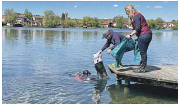
Auch das See-Ramadama ist eine Maßnahme zum Erhalt des Weißlinger Sees.