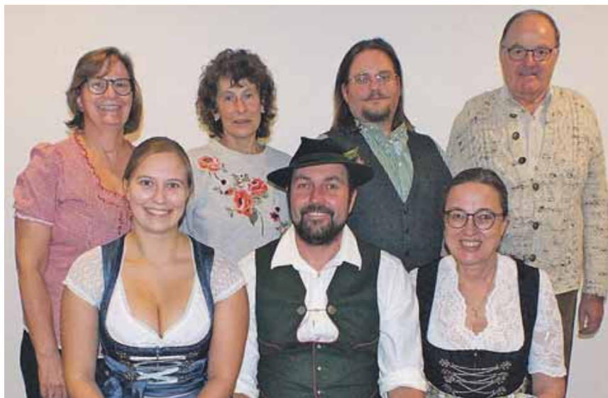
Die Bauernbühne Wörthsee spielt ihr neues Programm im November.

Dass er nach dem tragischen Unfalltod seiner Frau ganz schön abgestürzt ist, bestreitet der Fesl-Bauer gar nicht. Doch dass seine geldgierige Schwägerin Walli es geschafft hat, ihn mit Hilfe des Bürgermeisters zu entmündigen und sie als Vormund einzusetzen, macht ihm und Tochter Leni das Leben schon arg schwer – gilt er doch seitdem als der »Dorfdepp«. Aber jetzt hat er sich längst wieder gefangen und so suchen sie beide nach Möglichkeiten, »den Paragraphen« wieder loszuwerden, denn: »I bin zwar entmündigt, aber bläd bin i net!«. Allerdings hat erst Lenis heimliche