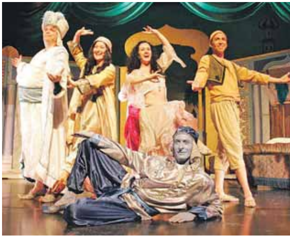
Das Musical Aladdin führt in die bunte und geheimnisvolle Welt des Orients.

GERMERING (red) · Die Geschichte von Aladdin und seiner Wunderlampe ist Teil der berühmten »Märchen aus 1001 Nacht«, die schon seit Hunderten von Jahren die Menschheit bezaubern. Spätestens seit der Adaption durch Disney und dem weltweiten Erfolg des Zeichentrickfilms ist die Geschichte auch ein Klassiker für Kinder und Familien. Die Neuaufgabe des Films aus dem Jahr 2019 – dieses Mal als Realverfilmung, nicht als Zeichentrick – begeisterte als Musicalsfassung auch durch die mitreißende Musik.