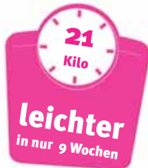
Zuzana Fedor 82319 Starnberg