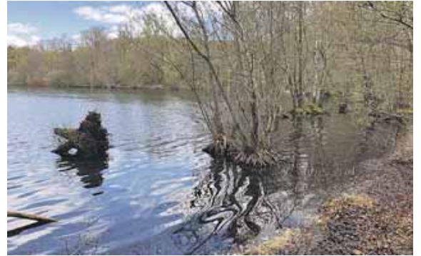
Der idyllische Weißlinger See.

In einer der nächsten Gemeinderatssitzungen komme hoffentlich der Antrag auf die Tagesordnung des Gemeinderats, erklärte Hackenberg. Dann wünscht er sich, dass ein neuer Aktionsplan be-