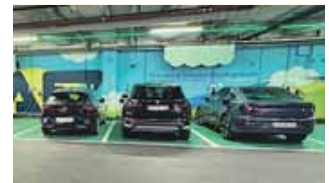
Laden beim Einkaufen: Für Kunden stehen in der Tiefgarage des AEZ auch E-Ladesäulen zur Verfügung.

den und jedes Bild bekommt auch einen Preis.« Als Hauptpreise gibt es einen Gutschein für ein EM-Trikot nach Wahl, einen original EM-Fußball – und natürlich viele weitere tolle Preise. Die Gewinner werden am Samstag, 20. Juli, vom AEZ bekanntgegeben.