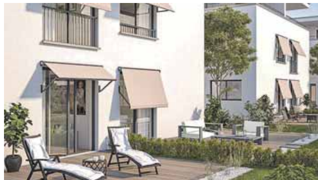
Fallarmmarkisen laufen nicht senkrecht, sondern können in einem variablen Neigungswinkel ausgestellt werden.

ausgestellt. Dadurch verbindet die Markisolettens Beschattung und Hitzeschutz mit guter Belüftung und Sicht für die dahinter liegenden Räume.