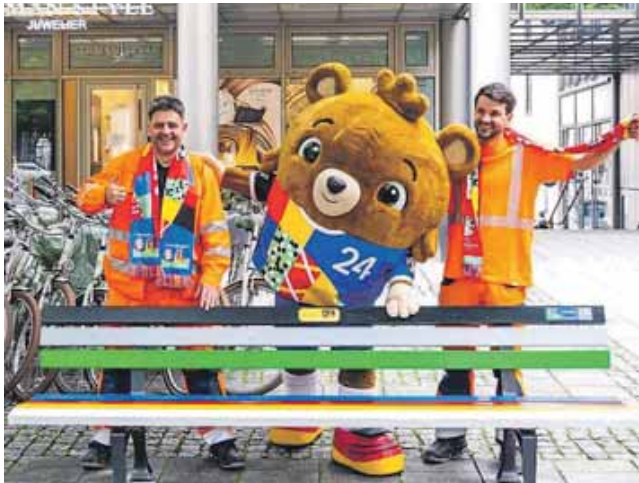
An den Bänken im EURO-Look kommen Menschen zusammen. Und hier auch Albärt, das Maskottchen der UEFA EURO 2024.