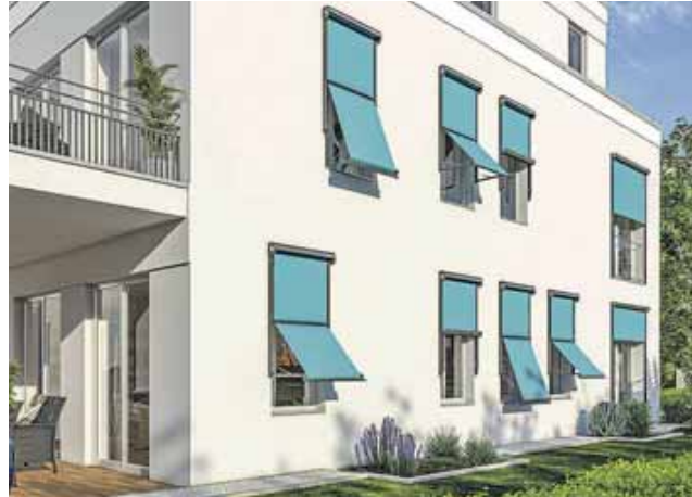
Markisolettens sind eine Kombination aus Senkrecht- und Fallarmmarkise.

Die senkrechten Markisen laufen parallel zum Fenster und lassen sich je nach Bausituation fassadenbündig in die Fensterlaibung oder vor die Fassade gesetzt montieren. Auch für die Tuchführung bieten Hersteller wie Lewens Markisen verschiedene Techniken an. Wie ein Reißverschluss funktioniert die Zip-Führung in seitlichen Schienen. Die Bespannung wird hierdurch straff gehalten und es gibt keinen seitlichen Lichteinfall. Erhalten bleiben Licht- und Luftschlitze bei der offenen Führung in einer Schiene oder an einem Seil. Unter www.lewens-markisen.de gibt es mehr Infos und Auswahlhilfen zu