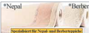
Schonende Wäsche auch für Berber- u. Schafwolleteppiche

..... weil unser Handwasch-verfahren nicht nur für Allergiker das Beste ist. ..... weil Staub, Schmutz, Motten, Milben, Mikrobiologische Belastung, Pilze und mehr dem Teppich zusetzen und der Gesundheit schaden.