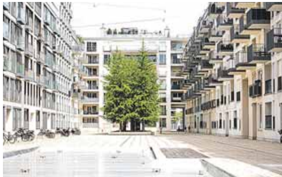
Eine Architekturansicht der Fotografin.

Perspektiven. Details wie der Lichteinfall auf einer Treppe, das Schloss eines Koffers oder die Makrofotografie einer Getreide-Ähre wechseln sich ab mit Natur- und Architekturansichten. Die Ausstellung ist bis einschließlich Mittwoch, 31. Juli, während der Öffnungszeiten der Stadtbibliothek Germering zu besichtigen. Der Eintritt zur Ausstellung ist frei.