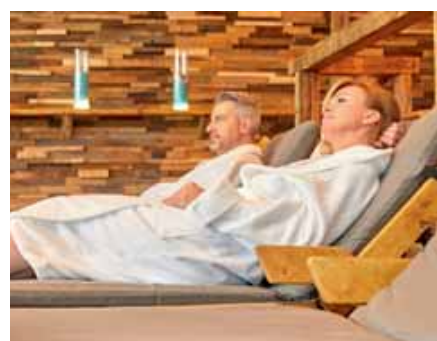
3.600 m 2 Thermal-Wellness-Landschaft