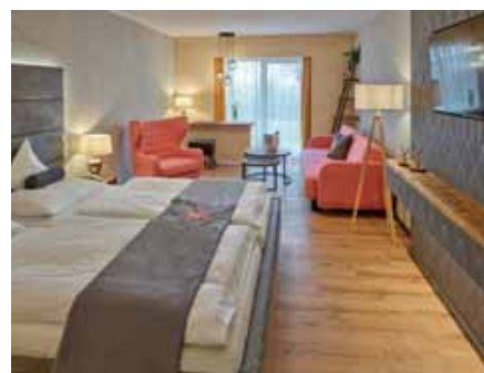
Premium-Zimmer (gg. Aufpreis möglich)