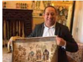
Inhaber der Firma Jacob & Söhne: "Qualität ist, wenn Qualität bleibt wie die Qualität war!"

Fachgerechte Beratung vor Ort - kostenlos & unverbindlich. Einfach anrufen und Termin vereinbaren.