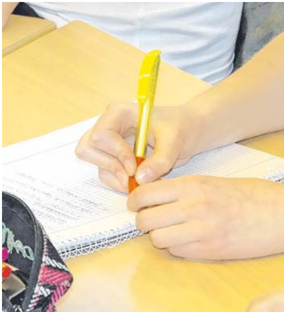
Sprachgefühl, Kreativität und natürlich die Freude am Schreiben sind beim Erstellen einer Schülerzeitung wichtig.

LANDKREIS · Der Schülerzeitungswettbewerb der Länder findet wieder statt: Prämiert wird außerordentliches Engagement durch die besten Schülerzeitungen Deutschlands. Bis zum 15. Januar können sich Redaktionen bei der Jugendpresse Deutschland für zahlreiche Preise bewerben. Acht Sonderpreise gibt es dieses Jahr beim Schülerzeitungswettbewerb der Länder zu gewinnen – zusätzlich zu den ersten bis dritten Plätzen und dem Onlinepreis in den sechs Schulkategorien – Grund-, Haupt-, Real- und Förderschulen, Gymnasien und beruflichen Schulen. Neben Preisgeldern bis zu 1.000 Euro sind eine feierliche Preisverleihung und der Schülerzeitungskongress mit einem vielfältigen Weiterbildungsprogramm durch Workshops Teil der Ehrung der Redaktionen.