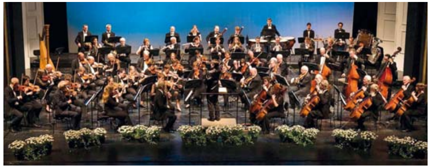
Das Deutsche Ärztetheater gibt erstmals ein Konzert in Andechs.