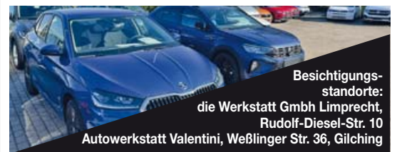
Besichtigungsstandorte: die Werkstatt GmbH Limplrecht, Rudolf-Diesel-Str. 10 Autowerkstatt Valentini, Weßlinger Str. 36, Gilching