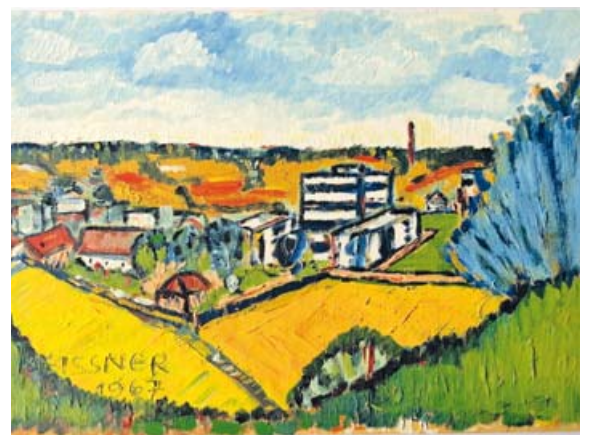
Fünf-Seen-Land 60er Jahre von Friedrich Meissner.

Eröffnung der Ausstellung am 10.11.2022 um 19 Uhr. Öffnungszeiten: Mo, Mi, Fr 8-12 Uhr. Di 8-12 und 13.30-15 Uhr. Do 8-12 und 13.30-18 Uhr. red