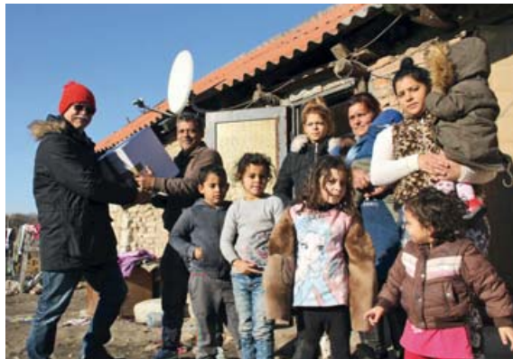
Die Menschen in Rumänien sind dankbar für die Unterstützung.

Aus Kapazitätsgründen werden wir in diesem Jahr nur Lebensmittelpakete, Weihnachtspakete, Kinderkleidung, Kinderschuhe und Spielsachen gesammelt. Wer helfen möchte,