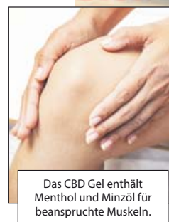
Das CBD Gel enthält Menthol und Minzöl für beanspruchte Muskeln.

Auch Experten der Qualitäts- marke Rubaxx haben sich intens- iv mit Cannabis beschäftigt. So ist es ihnen gelungen, eine spe- zielle Cannabispflanze der Sorte sativa L. mit hohem CBD-Gehalt zu finden. Aus ihr wird mittels eines komplexen CO 2 -Verfahrens reines CBD isoliert und aufwen- dig im Rubaxx Cannabis CBD Gel