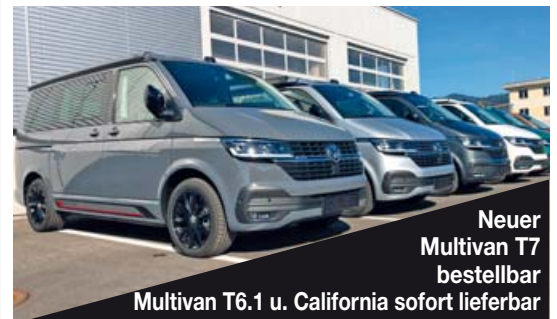
Neuer Multivan T7 bestellbar Multivan T6.1 u. California sofort lieferbar