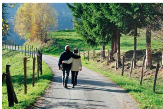
Bei Ausflügen mit Blasenschwäche zählt vor allem die richtige Vorbereitung.

Ob Wandern, Motorradfahren oder Radeln – Unternehmungen an der frischen Luft bieten Erholung, Entspannung und Abwechslung. Inkontinenzbetroffenen bereiten solche Aktivitäten aber oft Sor-