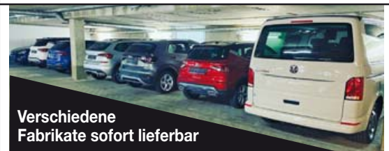
Verschiedene Fabrikate sofort lieferbar

E-Mail: verkauf@reimport-wimmer.de www.reimport-wimmer.de