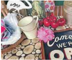
Alte und neue Schätze findet man in St. Martin.