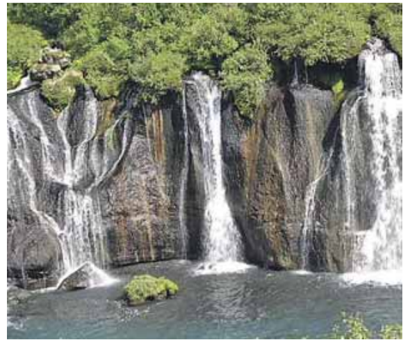
Durch das Land der Geysire und Vulkane führt Dieter von Essen wie ein unsichtbarer Reisebegleiter. Der Zuschauer meint, selbst vor Ort zu sein. Foto: Dieter von Essen

schauer, selbst im Geschehen mit dabei zu sein. Dieter von Essen begleitet die Zuschauer als unsichtbarer Reiseleiter und erzählt vieles über Natur, Kultur und die Tier- und Pflanzenwelt von Island. Untermalt werden die Aufnahmen von angenehmer, der Situation angepasster Hintergrundmusik, wobei auch die Musikauswahl von Dieter von Essen in Eigenregie erfolgte. Der Eintritt ist frei.