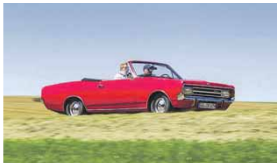
Vor der ersten Ausfahrt des Jahres mit dem Oldtimer ist eine Testfahrt ratsam.

(aum, red) · Im Frühjahr zieht es vermehrt auch wieder Oldtimerfahrer mit ihren automobilen Schätzen auf die Straße. Der Technikcheck nach der Winterpause sollte Pflicht sein. Aber auch der Fahrer selbst ist gefragt, denn in der Regel fehlt es im Old- oder Youngtimer an elektrischen Helferlein. Da gilt es, sich erst einmal wieder an das Fahren ohne Assistenzsysteme zu gewöhnen. So verfügen die rollenden Klassiker selten über einen Bremskraftverstärker. Zudem sind die Bremswege meist länger als bei heutigen Autos, mahnt die Gesellschaft für Technische Überwachung (GTÜ). Trommelbremsen verzögern nicht so spurtreu und gleichmäßig wie Scheibenbremsen und erst recht nicht, wenn sie durch Feuchtigkeit und Temperaturschwankungen Rost