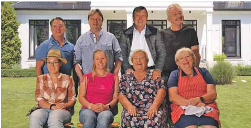
Bringt das Stück »Ein Fall mit Zwischenfällen« auf die Bühne: die Theatergruppe D'Forstenriada des TSV Forstenried. Collage: D'Forstenriada

Taschentücher gibt's im Supermarkt. Blut NICHT.