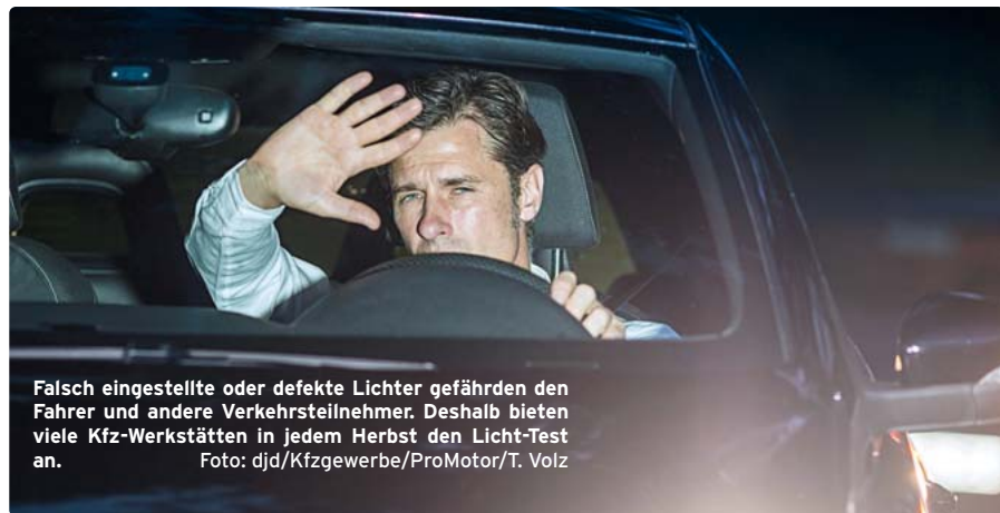
Falsch eingestellte oder defekte Lichter gefährden den Fahrer und andere Verkehrsteilnehmer. Deshalb bieten viele Kfz-Werkstätten in jedem Herbst den Licht-Test an.

Verkehrskontrolle signalisiert: Das Licht ist in Ordnung. Und ganz nebenbei können die Teilnehmer bei einem Gewinnspiel mitmachen, das als Hauptpreis einen Dacia Duster auslobt.