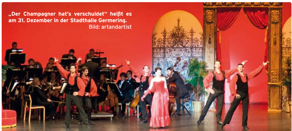
„Der Champagner hat's verschuldet“ heißt es am 31. Dezember in der Stadthalle Germering.

Germering · Auf eine prunkvolle Operettengala zum Jahreswechsel darf sich das Publikum am 31. Dezember in der Stadthalle Germering (Landsberger Str. 39) freuen. Um 15 und um 19.30 Uhr zeigen das Thalia Theater Wien und die Kammeroper Prag „Der Champagner hat's verschuldet“ im Orlandosaal. Evergreens mit Pointen Neben mitreißenden Ouvertüren, Walzern und Polkas erklingen die schönsten Melodien aus hundert Jahren des vermeintlich leichten Genres Operette, das doch allzu oft unterschätzt wird. Unter der Leitung und Regie des Wiener Tenors Alexander Klinger erwartet das Publikum ein kurzweiliger Abend, der ein wenig nach Champagner und Kabarett duftet. Es erklingen die Evergreens aus den berühmtesten Operetten von Johann Strauß, Franz Lehár, Emmerich Kálmán, Robert Stolz und Leo Fall. Gewürzt und serviert mit zahlreichen Pointen, szenischen Einlagen und komischen Dialogen. Alexander Klinger führt in Doppelconferé mit dem Wiener Bassisten Ivaylo Guberov kundig, anekdotenreich, pointiert und kurzweilig durch diesen vergnüglichen und schwungvollen Abend. Infos und Karten unter www.stadthalle-germering.de