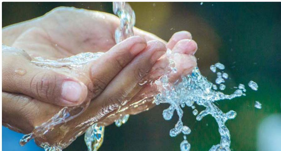
Trinkwasser ist kostbar. Brauchwasseranlagen reduzieren seinen Verbrauch erheblich