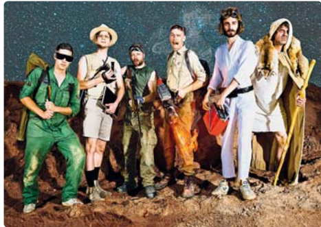
Pam Pam Ida kommen im März nach Gilching.

Vorverkauf für „Musik im Rathaus“ startet