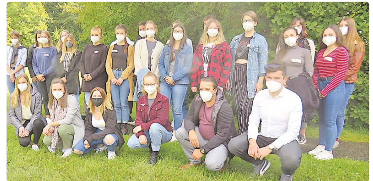
Insgesamt 47 Frauen und Männer haben in den Starnberger Kliniken sowie der Klinik Dr. Robert Schindlbeck ihre Ausbildung begonnen.