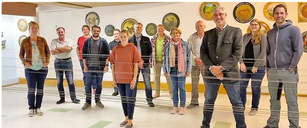
Die neue Vorstandschaft bei der Schützengesellschaft Tell Erling-Andechs e.V.: Die bestehende Vorstandschaft zeigte sich solide und viele Personen der letzten Vorstandschaftsperiode besetzten wieder die verschiedenen Vorstandschaftsämter.

Verein dankt allen alten sowie den neuen Vorstandsmitgliedern für ihre Unterstützung. red