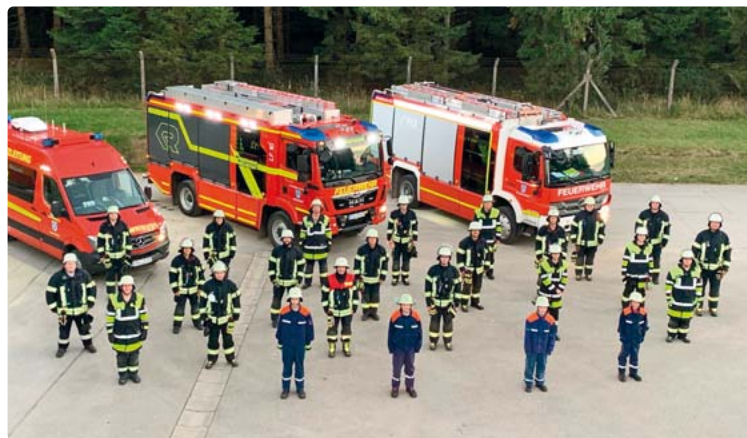
25 Feuerwehrleute der Feuerwehren Hochstadt und Oberpfaffenhofen probten zwölf Stunden lang diverse Notfallszenarien.

Alle Mitwirkenden waren am Ende zwar geschäftig doch gleichzeitig froh darüber, dass der Übungstag durchgeführt und die organisationsübergreifende Zusammenarbeit trainiert werden konnte. eis