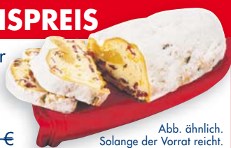
Abb. ähnlich. Solange der Vorrat reicht.