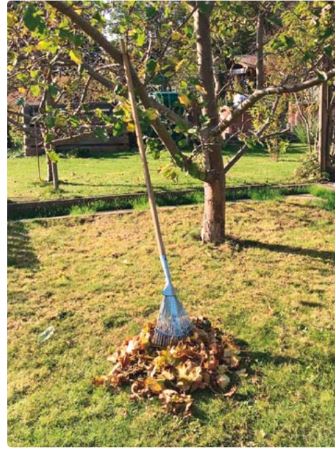
Laub lieber mit dem Rechen zusammenkehren, der Umwelt zuliebe.

Die Stadt Starnberg rät, das Laub für den Winter unter die Büsche oder in die Beete zu kehren. Über den Winter bietet es Kleintieren Schutz, und im Frühjahr entsteht wertvoller Humus. Zudem ist der Boden besser gegen Austrocknen oder extreme Temperaturen geschützt. Wer trotzdem nicht auf die Hilfe eines Laubbläfers oder Laubsaugers verzichten möchte, sollte am besten ein elektrisches Gerät kaufen und dieses sinn-