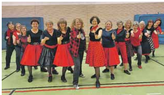
Bei der TSG München begegnet man trüben Wintertagen mit buntem Vergnügen.

Die TSG bietet im Januar und Februar Probetrainings an, bei denen Interessierte verschiedene Tanzgruppen ausprobieren und den Verein besser kennenlernen können. Es gibt Angebote für Kinder, Jugendliche, Erwachsene, für Singles und auch Paare. Alle Angebote findet man unter www.tsg-muenchen.de Besonders spannend wird es am Sonntag, 26. Januar: An diesem Tag veranstaltet die TSG gemeinsam mit »Kulturbunt« einen Tanzabend unter dem Motto »Boogie meets Discofox« im Kulturhaus Neuperlach, Albert-Schweitzer-Straße 62/1.Obergeschoss. Der Abend beginnt um 19 Uhr mit einem Einsteigerkurs, bevor um 20 Uhr die Party startet. Außerdem gibt es eine Showeinlage. Der Eintritt für beträgt 6 Euro. Weitere Infos warten unter der Webadresse kulturbunt-neuperlach.de