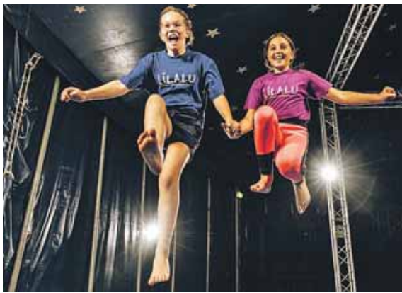
Eine bunte Palette von Workshops wartet beim Ferienprogramm Lilalu auf Kinder und Jugendliche. Schon jetzt sind sie buchbar.

MÜNCHEN (red) · Lilalu heißt das bekannte Ferienprogramm, bei dem der Johanniter-Regionalverband hauptsächlich ganztagsbetreute Workshops für Kinder und Jugendliche anbietet. Unter dem Jahresmotto »Ab durch die Wolken – wir wachsen gemeinsam« stehen in allen Schulferien verschiedene Ferienaktionen mit Sport, Tanz und sogar Luftakrobatik auf dem Programm. Heuer sind auch neue Workshops dabei: »Move yourself – Athletik, Sport & Spaß«, »Unstoppable! – Mut & Selbstbehauptung« sowie »Urban Art – Stencil & Designtechniken«