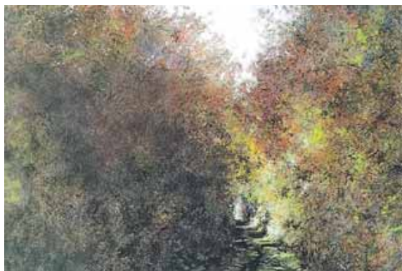
Malerei von Angelika Brach.

rer Herkunft oder Kultur teilen wir alle diese Verbindung zu unserer Erde und genießen dieses besondere Heimatgefühl. Die Vernissage der Ausstellung findet am Samstag, 6. April, um 19 Uhr im Bürgertreff (Am grünen Markt 7), statt. Am Sonntag, 7. April, kann die Ausstellung von 14 bis 17 Uhr unter Anwesenheit beider Künstler besichtigt werden. Die Ausstellung kann dann bis zum 29. Juni besichtigt werden. Der Eintritt ist frei.