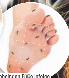
Kribbelnden Füße infolge von Nervenschmerzen?