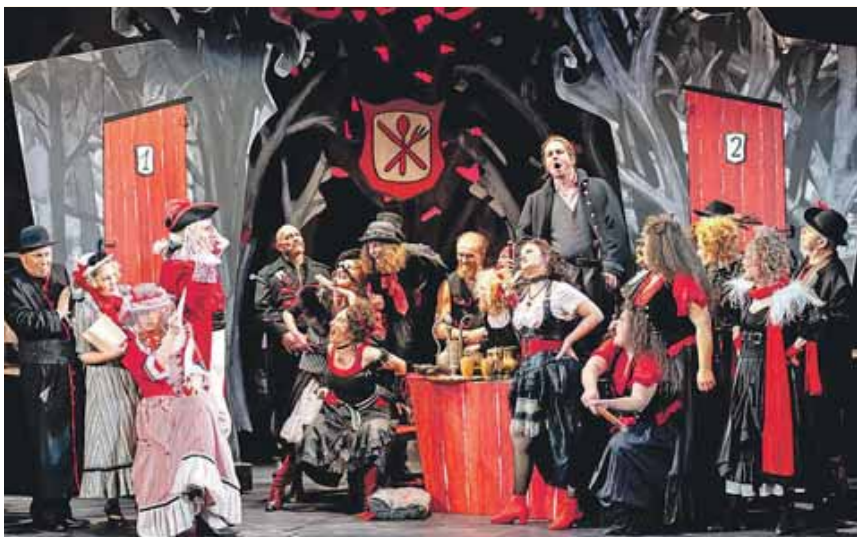
Lustiges Räuberleben: Im Wirtshaus geht's rund.

Doch das »Wirtshaus im Spessart« handelt auch noch von einem Handwerksburschen, der in die Kleidung und Rolle der Grafentochter schlüpft und umgekehrt. Jede Menge Räuber, die nicht nur dem Grafen Sandau das Leben schwer machen, sowie diverse Herzensangelegenheiten zwischen den Protagonisten, runden das vergnügliche Spektakel ab und haben die Geschichte um das Wirtshaus im Spessart bereits 1958 zum Erfolgsfilm gemacht, wobei