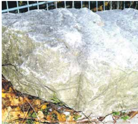
Der Eiszeitstein am Kleinen Stachus.

Gletscher brachten den »Minikoloss« zum Stachus