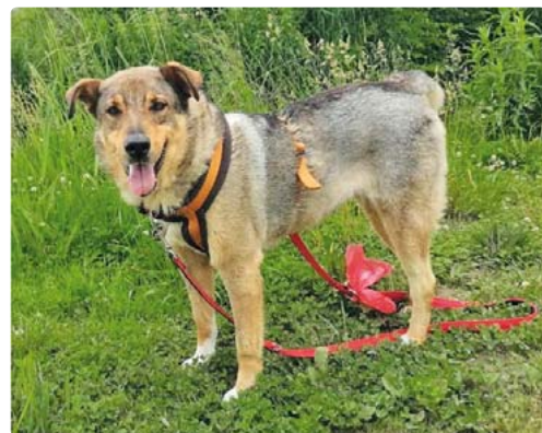
Die hübsche Ariel sucht dringend ein gutes Plätzchen, um endlich zur Ruhe zu kommen.

tras sie gerne als Einzelhund vermitteln. Wer sich für Ariel interessiert, findet unter http://www.tierfreunde-patras.de in der Rubrik „Unsere Hunde“ – „Zuhause gesucht“ Videos und weitere Fotos zu Ariel. Nach Drücken des Buttons „Ich interessiere mich für diesen Hund“ kann man ein Kontaktformular ausfüllen. bb