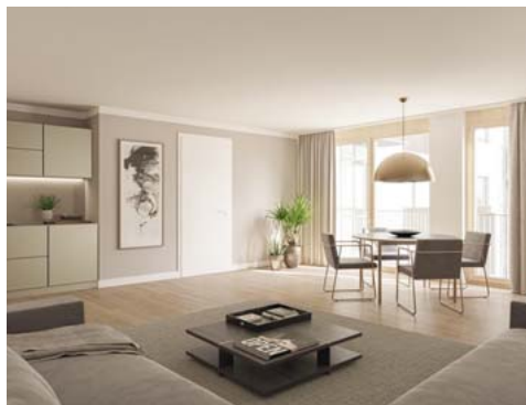
Das Neubauprojekt „DAS GULDEIN“ bietet 1- bis 4-Zimmer-Wohnungen mit wohngesunder Ausstattung.

Im GULDEIN stehen 1- bis 4-Zimmer-Wohnungen mit gut durchdachten Grundrissen, gehobener Ausstattung sowie hellen und großzügig anmutenden Räumen zum Verkauf. Die zum Hof ausgerichteten bodentiefen Fenster lassen viel Licht in die Räume. Jede Wohnung bietet zudem eine private Freifläche in Form einer Terrasse, eines Balkons oder einer Loggia. Qualitätsbewusstes Bauen wird bei Kutterhaus groß geschrieben. So legt die Allgäuer Firma, die für den Bau des Projekts verantwortlich ist, Wert auf Ressourcen-schonende und wohngesunde Materialien und hochwertige Ausstattung von Markenherstellern. Hochwärmedämmte Außenwände, 3fach isolierverglaste Fenster und eine Fußbodenheizung, die durch Fernwärme gespeist wird,