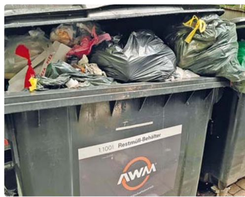
In vielen Wohnanlagen quellen die Restmülltonnen über. Oft wird es auch mit der Mülltrennung nicht so genau genommen.