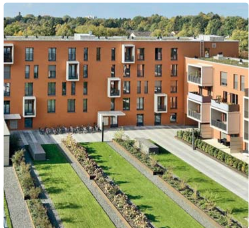
Das neue Stadtteilzentrum Fürstenried Ost hat einen neuen Innenhof bekommen.