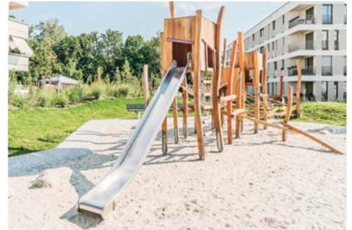
Am Freihamer Weg in Aubing wird der öffentliche Park mit Spielplätzen für drei Altersstufen, umgeben von Geschosswohnungsbauten, im Rahmen der Architektoren vorgestellt.