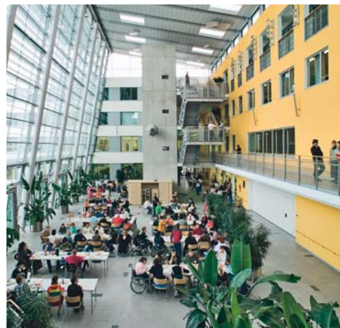
Blick in die schöne Glashalle der Stiftung ICP München.

„Das Besondere hier sind die kurzen Kommunikationswege zwischen den einzelnen Abteilungen und der freundliche Umgang der Kollegen und Kolleginnen untereinander. Es herrscht ein sehr reger Austausch zwischen Therapeuten, Tagesstätte, Schule und Wohnheim. Das macht die Arbeit sehr professionell und wir können unsere Teilnehmenden so optimal individuell nach ihren Bedürfnissen fördern. Wir Mitarbeiter können uns entfalten und Neues initiieren. Das wird immer unterstützt. So haben wir vor einigen Jahren begonnen, Ferienfreizeiten für unsere Kinder zu organisieren, um ihnen trotz ihrer Beeinträchtigungen erlebnisreiche und interessante Ferien zu ermöglichen. Städtereisen stehen dabei genauso auf dem Programm wie der Urlaub auf dem Bauernhof. Für uns Betreuer ist es schön, die Kinder mal länger und in den Ferien zu erleben und zu sehen, wieviel Spaß es ihnen macht, Neues zu entdecken. Und der große Erfolg unseres Angebots zeigt uns, dass wir mit unserer Idee den Kindern Barrieren aus dem Weg räumen und ihnen so mehr soziale Teilhabe ermöglichen.“