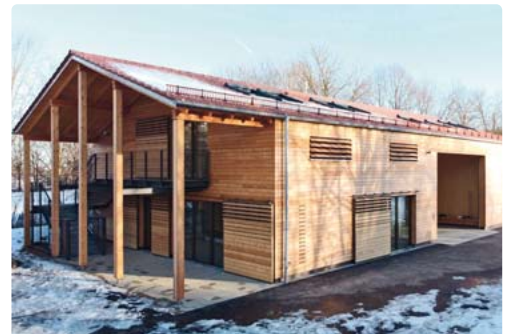
In Germering wird der Neubau von Werk-, Spiel- und Bewegungsräumen in leimfreiem Massiv-Holzbau für Abenteuerspielfeld am Aubinger Weg vorgestellt.