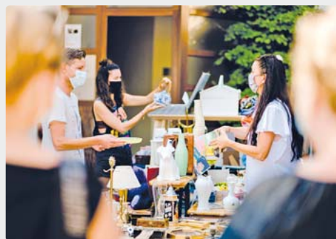
Am Freitag, 26. Juni, starten die ersten Hofflohmärkte in diesem Jahr in München. FFP2-Maske für das Bummeln nicht vergessen.