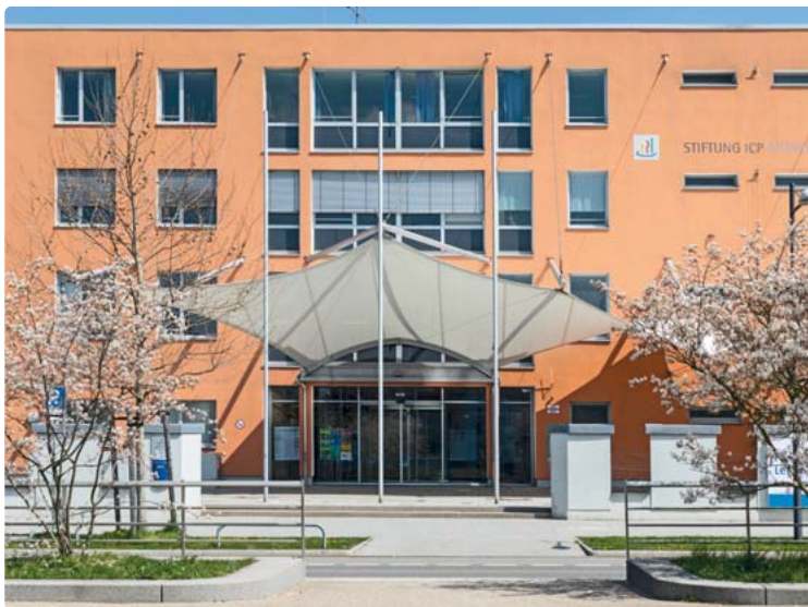
Die Stiftung ICP München ist direkt an der Garmischer Straße zu finden.

Wir haben uns einmal in der Nachbarschaft umgesehen und zwar bei der Stiftung ICP München. Die Stiftung ICP München unterhält mehrere Einrichtungen für Kinder, Jugendliche und Erwachsene mit einer Körperbehinderung, dazu integrative Kindertageseinrichtungen und eine inklusive Grundschule für Kinder mit und ohne Beeinträchtigung. Entsprechend viele Menschen mit unterschiedlichen Berufen aus dem sozialen Bereich sind hier beschäftigt, damit die rund 1.300 Teilnehmer und Teilnehmerinnen umfassend betreut und bestmöglich versorgt werden können. Ob frühkindliche Betreuung und Förderung, Schule, Berufsausbildung, Wohnen und Arbeiten – für jedes Lebensalter und jeden Bedarf gibt es das passende Angebot für Menschen mit Behinderung. Dazu gehören auch die Versorgung mit den entsprechenden Therapien sowie eine medizini-