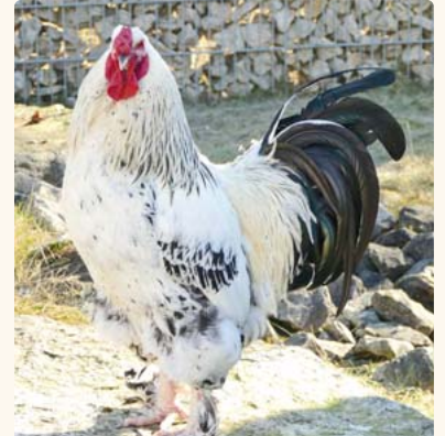
Brahma-Hahn Oschi.

Mit seinen 35 Jahren ist Charles bereits ein Senior, doch Aras können bis zu 40 Jahre alt werden, und das Tierheim wünscht sich für den charmanten Papagei eine möglichst gleichaltrige Dame, mit der er noch schöne Tage erleben kann. Leider musste der bezaubernde Vogel schon in seinem letzten Zuhause alleine leben und durch das Fehlen einer Artgenossin hat er damit angefangen, sich zu rupfen. Er mag Menschen, lässt sich aber nicht gerne anfassen. Stattdessen setzt er sich lieber auf einen Stock, mit dem man ihn dann problemlos überall hintragen kann. Wie viele Senioren hat Charles schon einige Wehwechen an den Gelenken, schlechte Augen und er muss Herzmedikamente nehmen. Trotzdem ist er voller Lebensfreude und mit einer