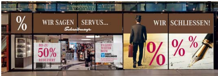
Schaufenster-Beklebung während des Abverkaufs vom Schreibmayr in den Fünf Höfen im November 2020.

Bis zu -50 % auf Artikel der Filiale Schreibmayr