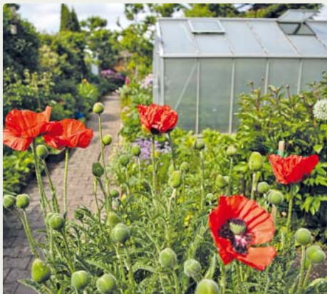
Im Garten der Familie Nicklbauer gibt es keinen Rasen, dafür Gemüse und immer wieder Mohn.

Pünktlich am Sonntag, 27. Juni, zum Tag der offenen Gartentür können sich Interessierte unter landkreis-muenchen.de selbst ein Bild machen und die Gärten online besuchen. red