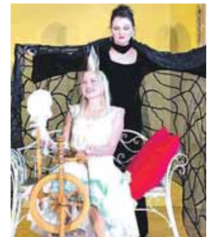
Die böse Fee sorgt dafür, dass sich Dornröschen an der Spindel sticht.

Am Sonntag, 15. September, ist es im Orlandosaal der Stadthalle Germering (Landsberger Str. 39) zu sehen. Karten zu 11 Euro (Kinder) sowie 15 Euro (Erwachsene)