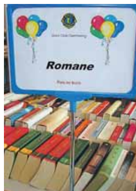
Die Bücher beim Lionsmarkt sind nach Themenbereichen sortiert.

Bereits ab 10 Uhr öffnet der Lions-Markt im Forum der Stadthalle seine Türen. Besucher können in einem riesigen Büchersortiment, Kleidermarkt und Trödelständen stöbern und das eine oder andere Schnäppchen machen.