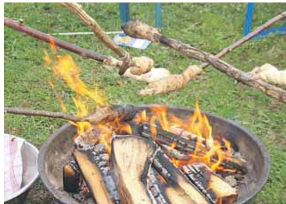
Stockbrot über das Feuer halten, ist für Kinder ein besonderes Erlebnis.

Höhepunkt: Um 14 Uhr erhält Germering das Siegel »kinderfreundliche Kommune«. Es wird an Städte und Gemeinden verliehen, die sich besonders für die Rechte und das Wohl von Kindern und Jugendlichen engagieren. Vergeben wird es von Unicef-Deutschland und dem Deutschen Kinderhilfswerk, basierend auf der UN-Kinderrechtskonvention. Kommunen verpflichten sich dabei, Kinderrechte stärker in ihre Politik einzubeziehen und kinderfreundliche Strukturen zu fördern. Das Siegel wird nach Umsetzung eines Aktionsplans verliehen und muss regelmäßig erneuert werden. Für die Ausgestaltung hatte die Stadt über 1000 Kinder und Jugendlichen nach ihren Wünschen befragt. Danach wird das Ganze groß gefeiert. Zahlreiche Germeringer Einrichtungen, Vereine und Institutionen haben ein vielseitiges Programm vorbereitet. Kinder können sich auf einen Bewegungsdschungel, eine Hüpfburg, Torwandwerfen und viele Bastelaktionen freuen. Spiel-, Sport- und Bewegungsangebote sorgen für jede Menge Spaß für alle Altersgruppen. Für das leibliche Wohl sorgt der Lionsclub mit Kaffee und Kuchen. Es gibt herzhaftes Speisen vom Grill, Flammkuchen und eine Prosecco-Bar. Verschiedene Musikgruppen werden auftreten, um für gute Stimmung zu sorgen.