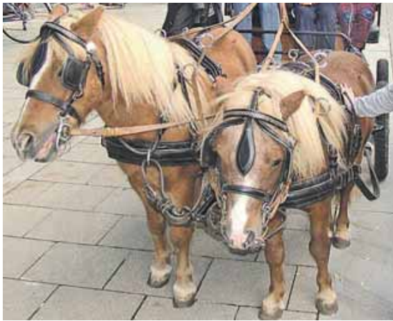
Die Kutsche mit den Ponys ist der Renner beim Kinderfest.

Das Kinderfest beginnt dieses Jahr mit einem besonderen Fortsetzung auf Seite 2