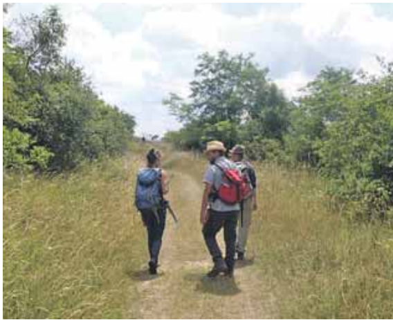
Zu jeder Jahreszeit bietet die App natur.digital verlässliche Informationen.

er etwa Gänse zersägt. Die App will aber nicht nur neue Freizeitmöglichkeiten aufzeigen, sondern auch ein Bewusstsein für die Natur wecken. So kommen auch naturschutzrelevante Themen vor. Zum Beispiel erfährt man, wo man unbesorgt grillen und zelten kann und wo man mit diesen Aktivitäten die Natur und ihre Bewohner stören würde. Auch für das Mitführen von Hunden gibt es eine Vielzahl an Ratschlägen und ebenso darüber, wie man mit Weidetieren entlang der Wege umgehen (oder besser nicht umgehen) sollte.