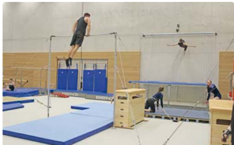
Gute Trainingsmöglichkeiten gibt es im ESV München für die Turner.

Die neue Halle wurde mit LED Lichtern ausgestattet, so dass der Energieverbrauch zukünftig erheblich gedrosselt werden kann. Auch in der bestehenden Dreifachhalle und in den Sportsälen sowie auf dem Hockeyplatz brennen schon LEDs. Auf dem Dach des neuen Sportgebäudes befindet sich zudem eine Photovoltaikanlage, so wird durch die energiesparenden Maßnahmen die CO2-Belastung nachhaltig reduziert. Ergänzt wird das Energiekonzept durch energiesparende Roof-Vents, die nicht nur be- und entlüften, sondern auch energieeffizient heizen und kühlen können.