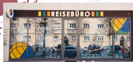
Das Team von 44 Travel heißt sie herzlich willkommen.