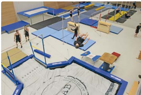
Das neue Bag-Jump-Kissen ermöglicht es den Turnern und Cheerleadern ihre Salti, Sprünge und Schrauben verletzungsfrei zu üben.