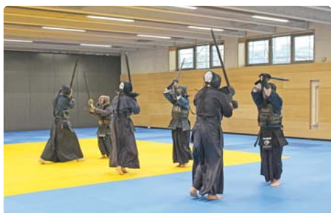
Die Kendo-Sportler üben bereits in ihrem neuen Dojo.