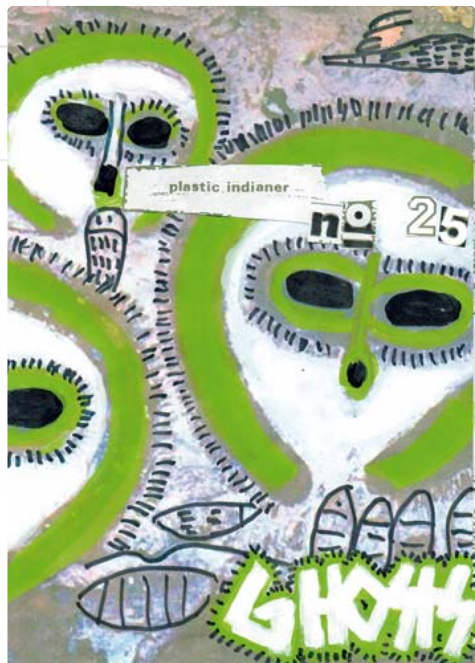
Die aktuelle Werkreihe von Bernhard Springer hat den Titel „Ghosts“.