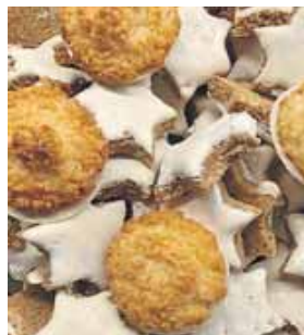
Neben Plätzchen gibt es viele weitere Köstlichkeiten.