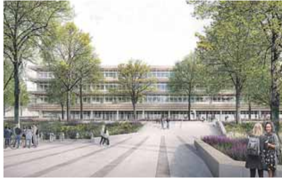
So soll das Berufsschulzentrum nach der Fertigstellung von außen aussehen. Foto: Schulz und Schulz Architekten

FREISING (chö) · Am vergangenen Dienstag fand eine Informationsveranstaltung zum geplanten Neubau des Berufsschulzentrums an der Wippenhauser Straße in Freising – mit Camerloher Gymnasium, FOS/BOS, Wirtschaftsschule und Berufsschule – statt. Eingeladen waren Eltern, Lehrkräfte, Schulleitungen sowie Schülerinnen und Schüler der betroffenen Schulen.