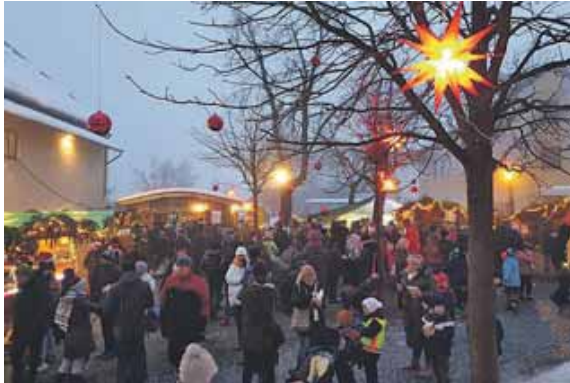
Die Mitte Attenkirchens verwandelt sich wieder in ein Weihnachtsdorf.

7. Dezember 2024 ab 16 Uhr | Dorfzentrum