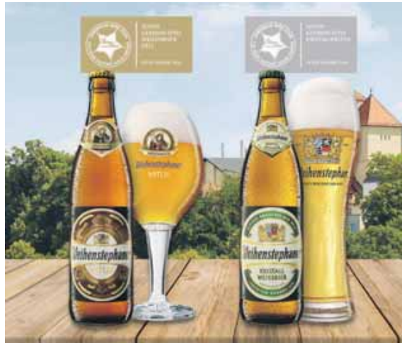
Gold für den Weizenbock Vitus, Silber für das Kristallweißbier: Foto: Weihenstephaner

Beer Star. Silber holte sich in der Kategorie South German-Style Kristallweizen das Weihenstephaner Kristallweißbier. Eine angenehme Rezenz, ein Hauch von Banane und ein klares Erscheinungsbild im Glas charakterisieren diese Bierspezialität. Ein kleiner Blick hinter die Weihenste-