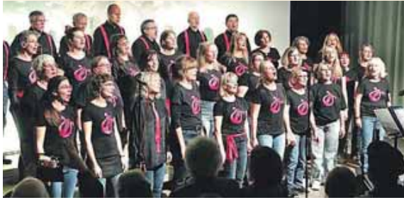
Ein weihnachtliches Konzert zum Jahresende.

FREISING (chö) · Die letzten zwei Jahre waren für die beiden Chöre »Jederzeit!« und »Coro Latino« alles andere als besinnlich, da zwischen dem 135ten Jubiläum des Vereins und dem Korbinian Projekt (1300 Jahre Freising) kaum Platz für die Adventszeit oder gar ein Weihnachtskonzert blieb. Nach dem Doppelerfolg des letzten Konzertes »Korbinian Zwo Vier« am 29. September im Lindenkeller möchten die