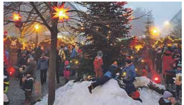
Das tolle Kinderprogramm bringt die Augen der Kleinen wieder zum Leuchten.

Auf eine magische Vorweihnachtszeit auf diesem ganz besonderen Adventsmarkt in Attenkirchen!