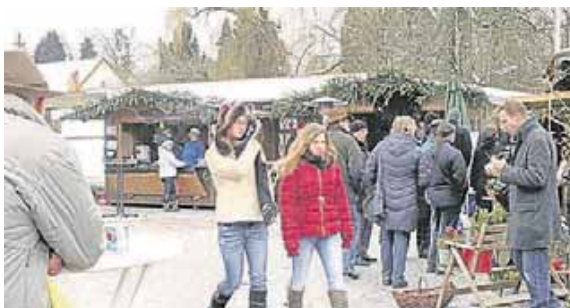
Endlich dürfen sich die Haager Bürger wieder auf ihren Weihnachtsmarkt freuen!

Der Haager Christkindmarkt ist ein beliebter Treffpunkt in der Region und verspricht auch in diesem Jahr unvergessliche Momente für Jung und Alt. Ein Besuch lohnt sich für alle, die sich von der weihnachtlichen Magie verzaubern lassen möchten.