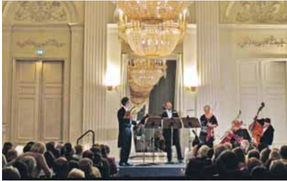
Bei Kerzenschein die Klänge der Residenzsolisten genießen.

MÜNCHEN (chö) · Den Geist Mozarts erleben – dort, wo der unsterbliche Jahrtausendkomponist selbst wirkte! Münchens Premiumveranstalter Bavaria Klassik hat sich auf unvergessliche Konzerterlebnisse spezialisiert, an denjenigen Orten, wo in München und Umgebung Geschichte geschrieben wurde.