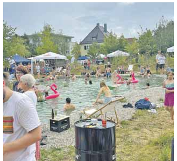
Im Naturteich konnten sich die Besucher eine willkommene Abkühlung holen.