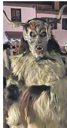
Einer der pelzigen Glücksbringer D'Boach-Peachtn bei der Arbeit.

HACHINGER TAL (red) · Die Angst vor dem Winter und vor der Dunkelheit hat den Menschen in früheren Jahrhunderten überall unheimliche Gestalten vorgegaukelt. Der Brauch des Perchtenlaufens ist als Gegenbewegung entstanden, um die dämonischen Mächte mit wildem Getöse und furchteinflößenden Masken zu vertreiben. Beim Perchtenlauf überträgt der Percht mit Stock, Goaßfuß oder Rosshaar das Glück auf die berührten Personen. Hier im Münchener Süden sind es seit dem Jahr 2008 »D'Boch Peachtn« aus dem Hachinger Tal, die die Leute im Ort weg vom Fernsessel, hin auf die Straße locken und mitten im Winter einen willkommenen Anlass zu einem Treff, Ratsch und gemeinsamen Rätselraten bieten, wer sich wohl hinter diesen grausam-schönen Masken verbergen könnte.