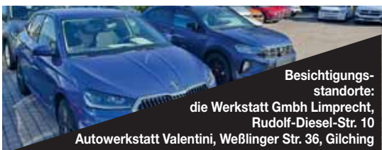
Besichtigungsstandorte: die Werkstatt GmbH Limprecht, Rudolf-Diesel-Str. 10 Autowerkstatt Valentini, Weßlinger Str. 36, Gilching