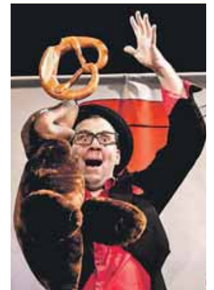
ZaPPaloTT hat auch einen echten Seehund mit dabei.

Ein Magisches-Mitmach-Theater, das Kinder stark macht. Zauberei, Clownerie, Theater und Kinderlieder, die ins Ohr gehen. Die Show ist für Kinder ab drei Jahren geeignet und dauert circa 70 Minuten. Es gibt keine Pause. Kleine und große Zaubervans können sich auf Sonntag, 26. Januar, freuen, um 15 Uhr beginnt die Show im Amadeusaal der Stadthalle Germering (Landsberger Straße 39). Karten kosten 8 Euro für Kinder und 10 Euro für Erwachsene und können bei allen VVK-Stellen von München Ticket, online unter germering.de/tickets , beim Café KartenGarten in Germering (Landsberger Str. 43) und an der Abendkasse erworben werden.