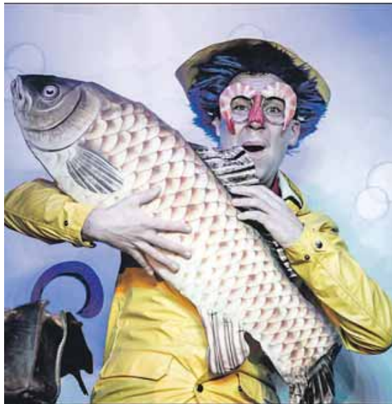
Der Zauberer ZaPPaloTT taucht am 26. Januar in der Stadthalle unter.

Dem Zauberer ZaPPaloTT ist super-mega-lalala-langweilig. Was soll er nur tun, an diesem trüben Schlechtwettertag? Hoppla! Durch einen verrückten Zufall taucht er gemeinsam mit den Kindern ab in eine fantastische Unter-