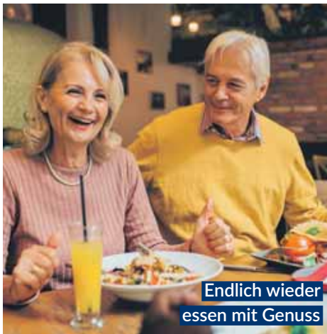
Endlich wieder essen mit Genuss

Gut essen? Gerne! Aber bitte mit Genuss! Nur leider machen Blähungen, Völlegefühl und Magenkrämpfe manch gesellige Runde zur mühsam ertragenen Qual. Damit Genuss in Zukunft genießbar bleibt, hält die Natur eine Lösung bereit: