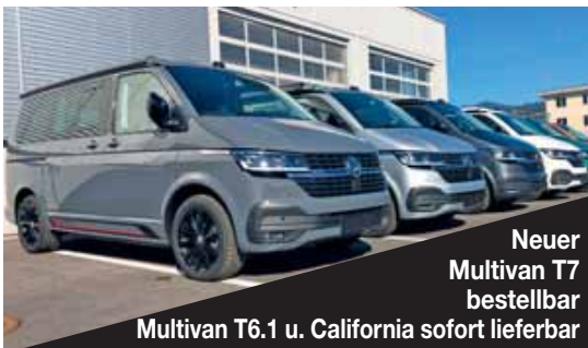
Neuer Multivan T7 bestellbar Multivan T6.1 u. California sofort lieferbar