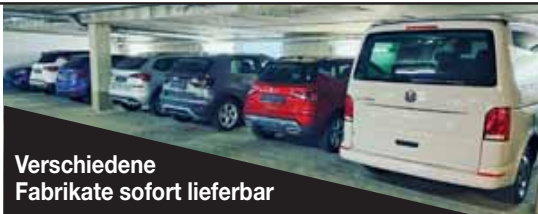
Verschiedene Fabrikate sofort lieferbar