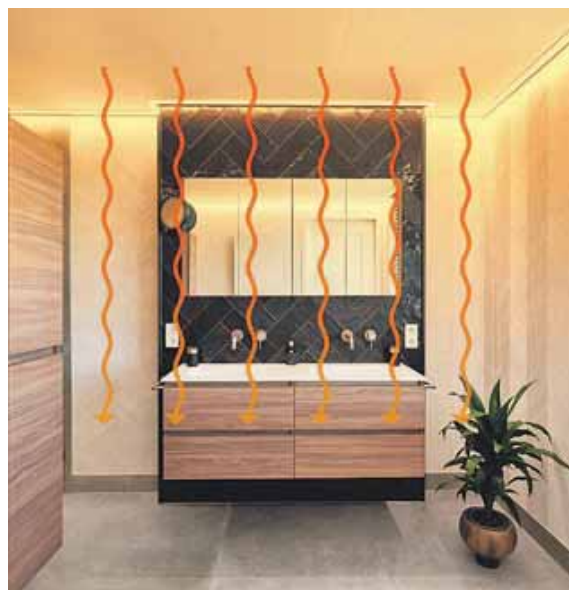
Plameco Aichach bietet IR-Heizungen an.

Plameco bietet neben schönen Spanndeckendesigns auch integrierte Beleuchtung, Schallabsorber und IR-Heizungen. Nur im Januar 2025 gibt's beim Kauf einer Plameco-Spanndecke die IR-Deckenheizung gratis (exkl. Dämmung und Steuerung).