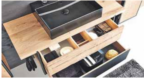
Massivholzmöbel im Badezimmer können gut mit Feuchtigkeit umgehen.

(IPM/RS) · Laut dem »Allergie Informationsdienst« des Helmholtz Zentrum München wird bei 15 Prozent der Erwachsenen im Laufe ihres Lebens ein Heuschnupfen diagnostiziert. Mit Pollenschutzgittern und ausgewählten Zeiten zum Lüften der Wohnung kann das Wohlbefinden im Zuhause verbessert werden, doch auch die Einrichtung kann hierbei unterstützen. »Dementsprechend zeichnet sich auch ein klarer Trend zum gesunden Wohnen mit natürlichen Möbeln in den eigenen vier Wänden