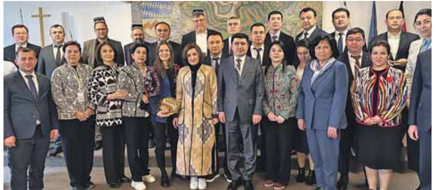
Die BesucherInnen aus Usbekistan im Landratsamt Dachau.

Studienreise aus Usbekistan macht Halt im Landratsamt