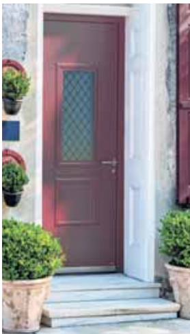
TÜREN FENSTER ÜBERDACHUNGEN

Augsburger Straße 38 85221 Dachau 08131/431 9 881 info@tueri.eu