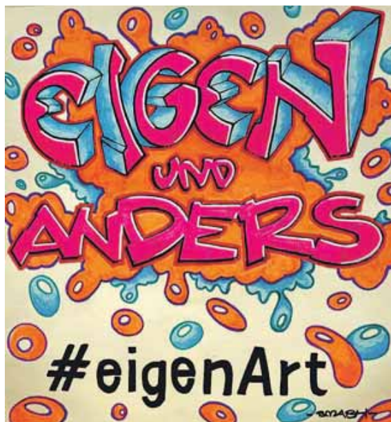
smash-styles – Ricky Romanelli – ein Freund der Band, hat das Album-Cover erstellt.

Unter dem Motto »Jeder Mensch ist anders, Musik kennt keine Behinderung« macht #eigenArt Menschen mit geistiger Behinderung in der Gesellschaft sichtbarer. Der Fokus liegt nicht auf der Behinderung, sondern auf Talent, Mut und Kreativität. Die Band besteht aus 24 Mitgliedern – 20 Menschen mit geistiger Behinderung sowie vier Mitarbeitende aus dem Franziskuswerk. Die Teilnehmer