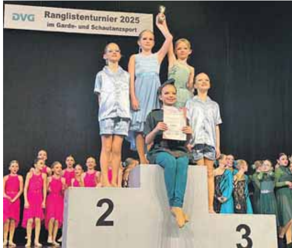
Für die Smallgroup des JTSC Karlsfelds war es das erste Turnier überhaupt.

Sensationelles Turnierwochenende in Velden für JTSC