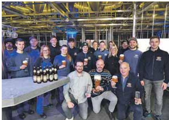
Ein bemerkenswertes Team. Zusammen schafften sie letztes Jahr 23 Auszeichnungen.

Besonders strahlte das Hefeweißbier Dunkel, das bei den WBA und der IBC gleich zweimal zum weltbesten Weißbier gekürt wurde.