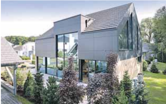
Nachhaltig und luxuriös wohnen: Beide Wünsche an das Zuhause lassen sich vereinen.

(djd) · Größe der Wohnfläche, Grundriss, Haustechnik: Bei der Planung eines Neubaus wollen zahlreiche Faktoren bedacht werden. Immer stärker rückt dabei auch das Thema Nachhaltigkeit in den Fokus, nicht nur wegen der staatlichen Vorgaben zur Energieeffizienz von Neubauten.