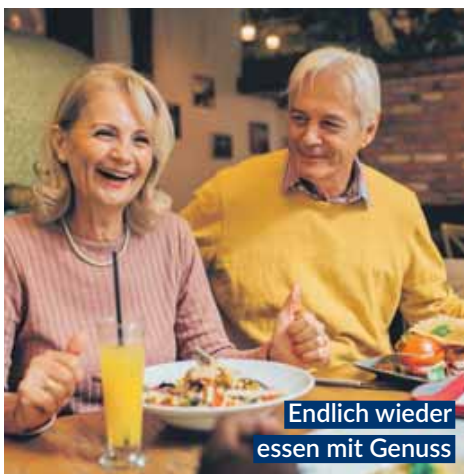
Endlich wieder essen mit Genuss

Bei Blähungen, Völlegefühl und Magenkrämpfen bringen GASTEO Magen-