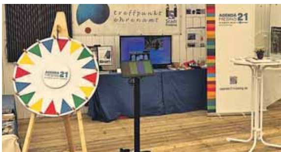
Die Agenda21 Energie und Klima informierte Besucher auf dem Uferlos Festival rund um das Thema Energiewende.