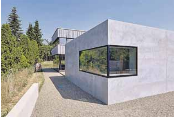
Energieeffizient und behaglich: Eine massive Bauweise mit Beton zahlt sich gleich mehrfach aus.

wird. Große Flächen wie oder auch Wandelemente können somit den klassischen Heizkörper sowie Klimaanlage ersetzen. Weiter verbessern lässt sich die energetische Bilanz, wenn die Energie zum Erwärmen oder Kühlen des Wassers aus regenerativen Energiequellen wie einer Photovoltaikanlage oder aus Geothermie stammt. Ein Vorteil: Die Bauteilaktivierung ermöglicht es, die Energiezufuhr zeitlich so zu steuern, dass sie nur dann erfolgt, wenn erneuerbarer Strom im Überschuss zur Verfügung steht. Unter bauen-mit-beton.de etwa gibt es ausführliche Informationen dazu. Insbesondere bei Spannbeton-Fertigdecken sind derartige Wärme-Kühl-