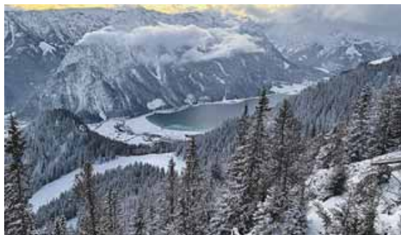
Ein herrlicher Ausblick!