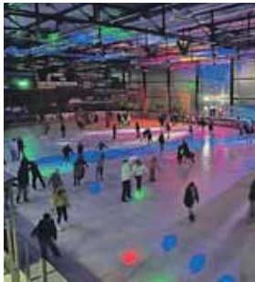
Schlittschuhlaufen trifft Party, das ist das Motto der Eisdisco in Freising.

FREISING (chö) · Die Eishockeyabteilung Black Bears Freising starteten mit einem glanzvollen Event ins neue Jahr. Die erste Eis-Disco-Night des Jahres zog zahlreiche Besucher aus Freising und Umgebung an, die das einzigartige Disco-Feeling auf dem Eis erleben wollten. Unter dem Motto »Schlittschuhlaufen trifft Party« verwandelte sich die Eisfläche in