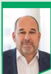
RA Georg Hopfensperger Rechtsabteilung HAUS + GRUND MÜNCHEN

Frau Müller aus München fragt: Ich habe in meinem Mietshaus Modernisierungsmaßnahmen nach dem Gebäudeenergiegesetz durchgeführt und die Heizung ausgetauscht. Der Mieter möchte wegen der Beeinträchtigungen durch die Baumaßnahmen die Miete mindern. Ist dies zulässig?