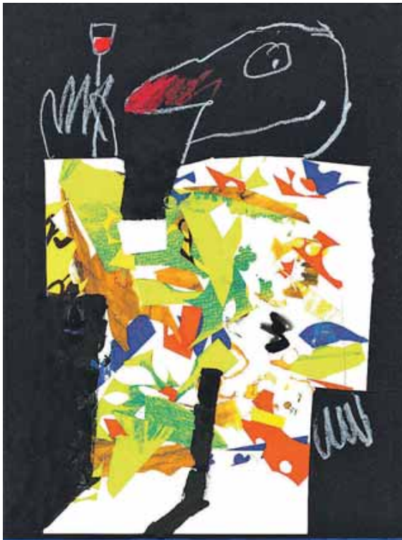
Ein Werk des 2018 verstorbenen Künstlers Egbert Greven.