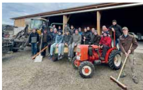
Die Helfer der Burschenschaft Hadorf sind bereits mit den Aufbauarbeiten beschäftigt.