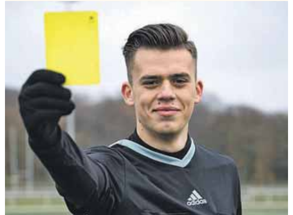
»Respekt immer und überall!«: Schiedsrichter-Star »Qualle« ist beim M-net Turnier dabei.

WESSLING (red) · Fast 100 Mannschaften mit rund 1.000 Spielerinnen und Spielern sind am ersten Februar- und ersten März-Wochenende bei den M-net Hallentagen des SC Weßling zu Gast. In insgesamt zwölf Altersklassen kämpfen Teams aus dem gesamten Landkreis Starnberg und der Region München um die Titel – und machen das Turnier zu einem der größten Vereinssport-Events der gesamten Region. Dabei bietet das Turnier auch im vierten Jahr seines Bestehens einige Besonderheiten: Erstmals tritt neben den Junioren und A-Senioren auch der weibliche Fußball-Nachwuchs in zwei Turnieren gegeneinander an. Zudem werden einige Partien von dem bekannten Schiedsrichter-Influencer »Qualle« gepfiffen. Möglich wird das Turnier auch in diesem Jahr durch die Unterstützung des Titel-Sponsors M-net, der im gesamten Landkreis Starnberg schnelle Internet- und Telefonanschlüsse bietet. Los geht es am Freitag, 31. Januar, um 18.30 Uhr mit dem Turnier der A-Senioren. Am Samstag, 1. Februar, folgen die Turniere der U12 (9 Uhr),