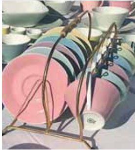
Allerlei Schätze kann man beim Flohmarkt am Volksfestplatz finden.

EBERSBERG (red) · Der Flohmarkt auf dem Volksfestplatz und in der Volksfest-Halle in Attenberger-Schillingen Straße 1 findet erstmalig dieses Jahr am Sonntag, 30. März, von 08.00 bis 16.00 Uhr statt. Standreservierungen für einen bestimmten Standplatz sind gegen Vorkasse möglich. Die Standmiete sollte spätestens 14 Tage vor Beginn der Veranstaltung ohne Verzögerung per PayPal an m.gaouit-online.de gesendet werden.