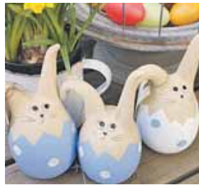
Lustige Osterdeko findet man auf dem Kunsthandwerksmarkt.

NEUPERLACH (red) · Ein österlicher HobbyKunst- und Kreativmarkt findet im Stadtteilbüro Neuperlach am Sonntag, 30. März, von 11.30 bis 16.30 Uhr im Gerhart-Hauptmann-Ring 56, statt. Die Aussteller sind Hobby-künstler, Kunsthandwerker