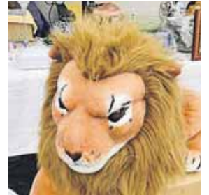
Der Bürgerkreis veranstaltet wieder Flohmärkte für den guten Zweck.

NEUPERLACH (red) · Der Bürgerkreis Neuperlach e.V. lädt wieder zu seinen beliebtesten Flohmärkten auf dem Parkplatz der Deutsche Rentenversicherung in der Fritz-Schäffer-Straße in Neuperlach ein. Diese finden zu folgenden Terminen statt (sofern das Wetter mitspielt – bei Regen entfallen die Termine): Samstag, 29. März. Weitere Flohmärkte finden statt am 5. und 12. April. Der Einlass für Aussteller erfolgt um 7.00 Uhr, der Aufbau erfolgt ab 7.45 Uhr. Der Einlass für Besucher ist ab 8.00 Uhr. Der Flohmarkt endet um 15.00 Uhr. Der Platz muss sauber verlassen werden.