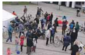
Der Fahrradflohmarkt in Unterhaching.

kauft werden. Für den Radflohmarkt wird keine Standgebühr erhoben und es gibt auch keine Anmeldung. Er findet bei jedem Wetter statt. Der ADFC ist dort auch mit seinem Lastenrad mit einem Infostand vertreten.