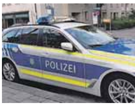
Der Polizei gelang es diese Woche zahlreiches Beweismaterial im Bereich der Kinderpornographie sicherzustellen.

MÜNCHEN - LANDKREIS (red) · Am Mittwoch, 19. März, wurden durch das er-mittelnde Kommissariat 17 in den Abendstunden unter Sachleitung der Staatsan-waltschaft München I und dem bei der Generalstaatsan-waltschaft Bamberg einge-richteten Zentrums zur Be-kämpfung von Kinderporno-graphie und sexuellem Miss-brauch im Internet (ZKI) um-fangreiche Durchsuchungen durchgeführt. Im Kampf gegen Kinder- und Jugendpor-nografie durchsuchten über 45 Einsatzkräfte der Polizei auf richterliche Anordnung hin 15 Wohnungen in Stadt-gebiet (11) und Landkreis München (4: Unterschleiß-heim, Ottobrunn, Putzbrunn, Aschheim). Bei den insgesamt 15 männli-chen Tatverdächtigen im Alter