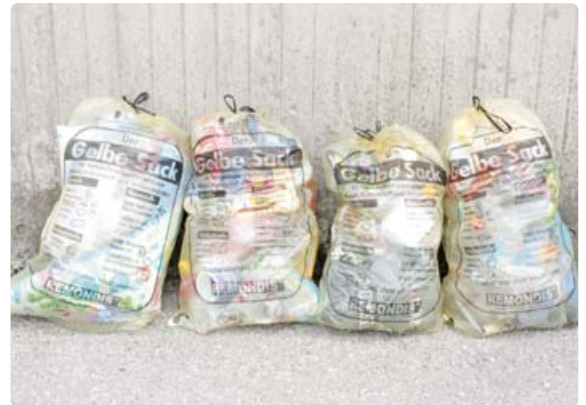
System Gelber Sack: Im Landkreis Starnberg werden Kunststoffverpackungen bei den Bürgern abgeholt.

LANDKREIS · Um Auswirkungen von Verpackungsabfällen auf die Umwelt zu vermeiden bzw. zu verringern, gibt es in Deutschland das Verpackungsgesetz. Dieses verfolgt das Ziel, durch Recycling möglichst viele Verpackungsabfälle innerhalb der Wertstoffkreisläufe zu erhalten. Doch nur wenn die Verpackungen korrekt getrennt und gesammelt werden, können die vom Gesetzgeber vorgeschriebenen hohen Recyclingquoten auch erfüllt werden.