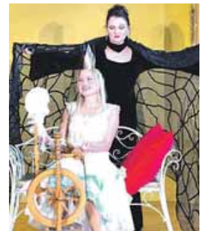
Die böse Fee sorgt dafür, dass sich Dornröschen an der Spindel sticht.

können bei allen VVK-Stellen von München Ticket, online unter www.stadthalle-germering.de/tickets , beim Café KartenGarten in Germering (Landsberger Straße 43) und an der Tageskasse erworben werden.