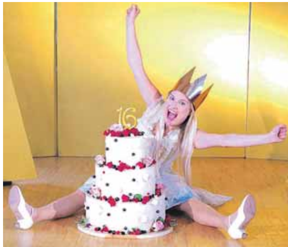
Dornröschen wird 16 Jahre alt. An seinem Geburtstag soll sich der Fluch erfüllen.

100 Jahre später treffen wir den Urenkel des Prinzen, mit dem Dornröschen einst verlobt war, und auch die böse Fee wieder, die jetzt als moderne Geschäftsfrau ihr Un-