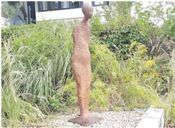
»Vision« heißt die Eisen-Skulptur des Künstlers Thaddäus Salcher, die seit kurzem auf der »Plattform für temporäre Kunst« am Rathaus Gräfelfing steht.

GRÄFELFING (us) · Die traditionellen Sommerausstellungen des Kunstkreises Gräfelfing e.V. werden in diesem Jahr um ein hochkarätiges Herbstprogramm ergänzt. »Wir freuen uns sehr, dass wir im November eine Cartoon- und Karikaturen-Ausstellung im Alten Rathaus präsentieren können«, kündigte Ingrid Gardill, Kunsthistorikerin und zweite Vorsitzende des Vereins. »Die Idee dazu haben wir schon eine längere Zeit. Es ist wunderbar, dass wir sie nun verwirklichen können. Das wird etwas ganz Feines«, freute sie sich. Gerade im etwas tristen