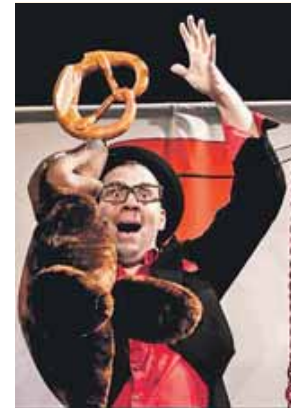
ZaPPaloTT hat auch einen echten Seehund mit dabei.

Ein Magisches-Mitmach-Theater, das Kinder stark macht. Zauberei, Clownerie, Theater und Kinderlieder, die ins Ohr gehen. Die Show ist für Kinder ab drei Jahren geeignet und dauert circa 70 Minuten. Es gibt keine Pause. Kleine und große Zaubervans können sich auf Sonntag, 26. Januar, freuen, um 15 Uhr beginnt die Show im Amadeusaal der Stadthalle Germering (Landsberger Straße 39). Karten kosten 8 Euro für Kinder und 10 Euro für Erwachsene und können bei allen VVK-Stellen von München Ticket, online unter germering.de/tickets , beim Café KartenGarten in Germering (Landsberger Str. 43) und an der Abendkasse erworben werden.