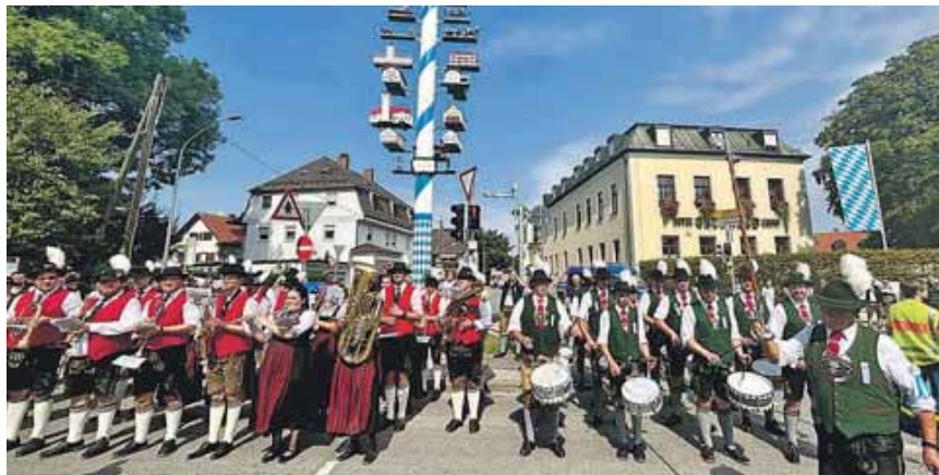
Im Jahr 2024 feierten die Aubinger 130 Jahre Männergesangsverein. In diesem Jahr feiern sie 75 Jahre Aubinger Maibaum.