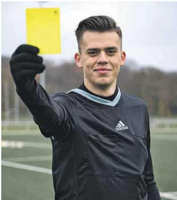
»Respekt immer und überall!«: Schiedsrichter-Star »Qualle« ist beim M-net Turnier dabei.

Los geht es am Freitag, 31. Januar, um 18.30 Uhr mit dem Turnier der A-Senioren. Am Samstag, 1. Februar, folgen die Turniere der U12 (9 Uhr), U13 (13.15 Uhr) und U16 (17.45 Uhr), bevor am Sonntag, 2. Februar, die U11 (8.30 Uhr), die U12 weiblich (12.45 Uhr) und die U15