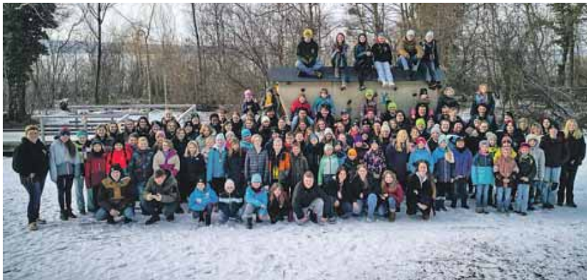
Rund 130 Mitglieder waren zum Abschlusswochenende des Jugendrotkreuzes nach Weilheim gekommen.

Am Freitagmorgen starteten die Teilnehmenden mit einem Warm-Up im Freien. Im Anschluss standen zahlreiche Workshops auf dem Programm, darunter Themen wie Makramee, Glückswürmchen häkeln, Zeichenschule und die sieben Grundsätze des Roten Kreuzes. Ein Ausflug führte die Jugendlichen zur Abfallentsorgung der Region, wo sie mehr über Abfallwirtschaft und Recyclingprozesse erfuh-