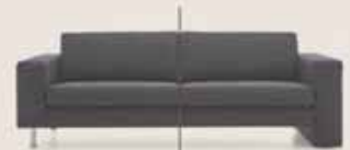
LM 620 Fuß: 620