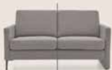
LM 609 Fuß: 600 schwarz

Sitzkissen- und Rückenkissen für jede Vorliebe! Von Daunencharakter bis Taschenfederkern