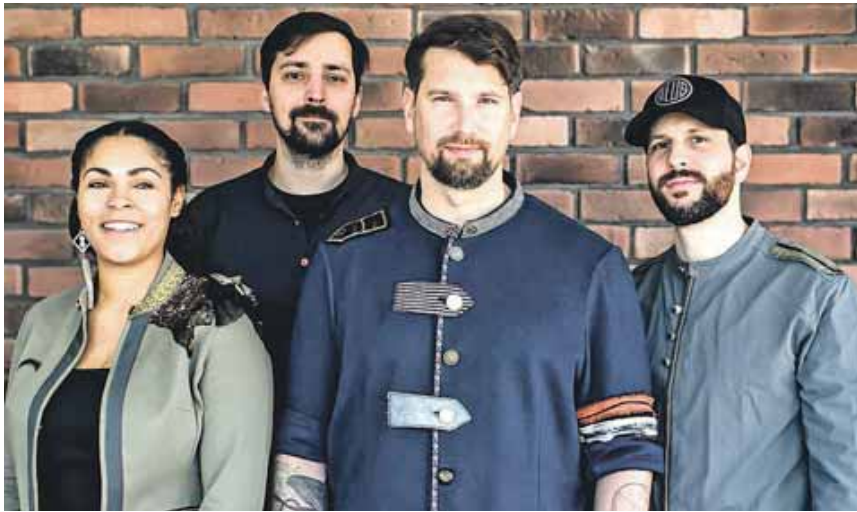
Fühlt sich im Genre Indie-Rock zuhause: die Band Sondermarke.