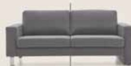
LM 616 Fuß: 600