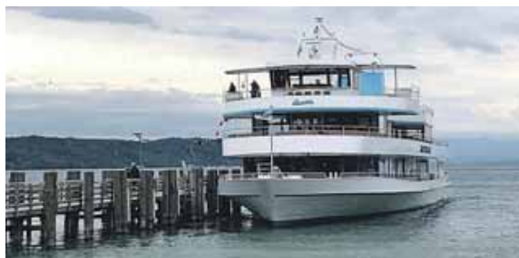
Eine Schifffahrt über den schönen Ammersee gehört zum Ausflugsprogramm.

sching zum Mittagessen im Seehof, direkt am Seeufer. Auf der anschließenden Schifffahrt quer über den Ammersee können wir die wunderbare Landschaft rund um den See genießen. Auf der Heimfahrt lassen wir mit einer gemütlichen Einkehr zu Kaffee und Kuchen einen hoffentlich schönen Tag ausklingen. Anmeldung ab sofort unter Telefon 080 24/40 68. Auch Nichtmitglieder und Interessierte dürfen sich gerne anmelden. Die Vorstandschaft wünscht einen schönen Ausflug und freut sich auf rege Teilnahme. Abfahrtszeiten sind: In Otterfing um 8.10 Uhr bei der Raiffeisenbank, in Holzkirchen am Bahnhof um 8:15 Uhr, am Landl um 8.25 Uhr und am Marktplatz um 8.30 Uhr.