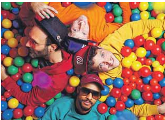
Eichhorn und der lila Hund ist ein Riesenspaß für Kinder. Und überhaupt für alle großen und kleinen Menschen.