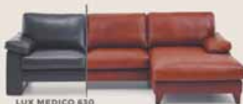
LUX MEDICO 630 Mit XL-Longhair und Armlehne (Mehrpreis) Fuß: Bodentief