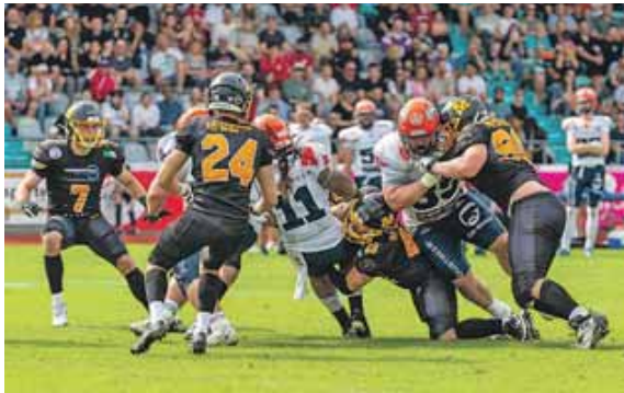
Die Munich Cowboys empfangen Ravensburg Razorbacks zu ihrem letzten Heimspiel der Saison im Dantestadion am 7. September (Kick Off 16 Uhr).

Letztes Heimspiel der Munich Cowboys am 7. September